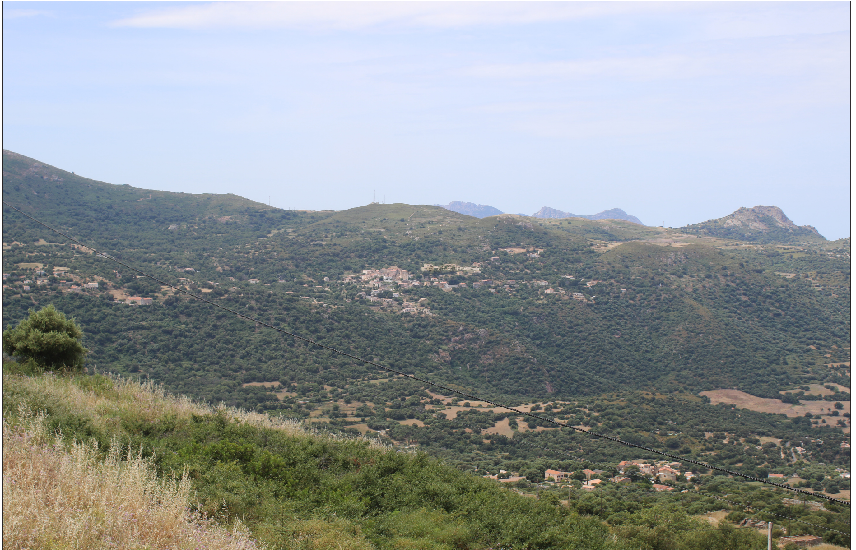
Annexe 3d. Insertions paysagère du projet en vue éloignée (3 km)