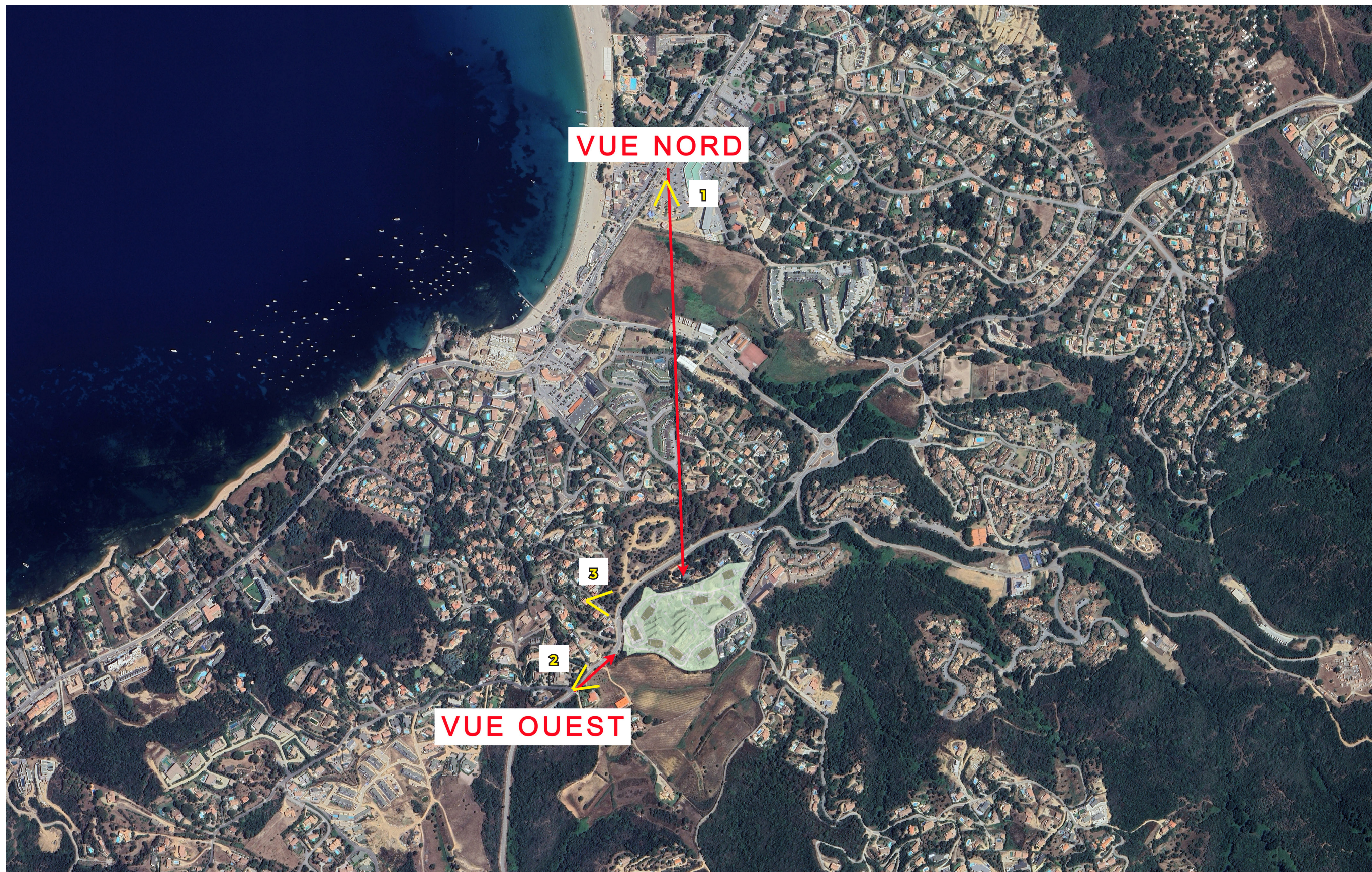
Annexe 3a : Cartographie localisant les emplacements choisi pour les photographies