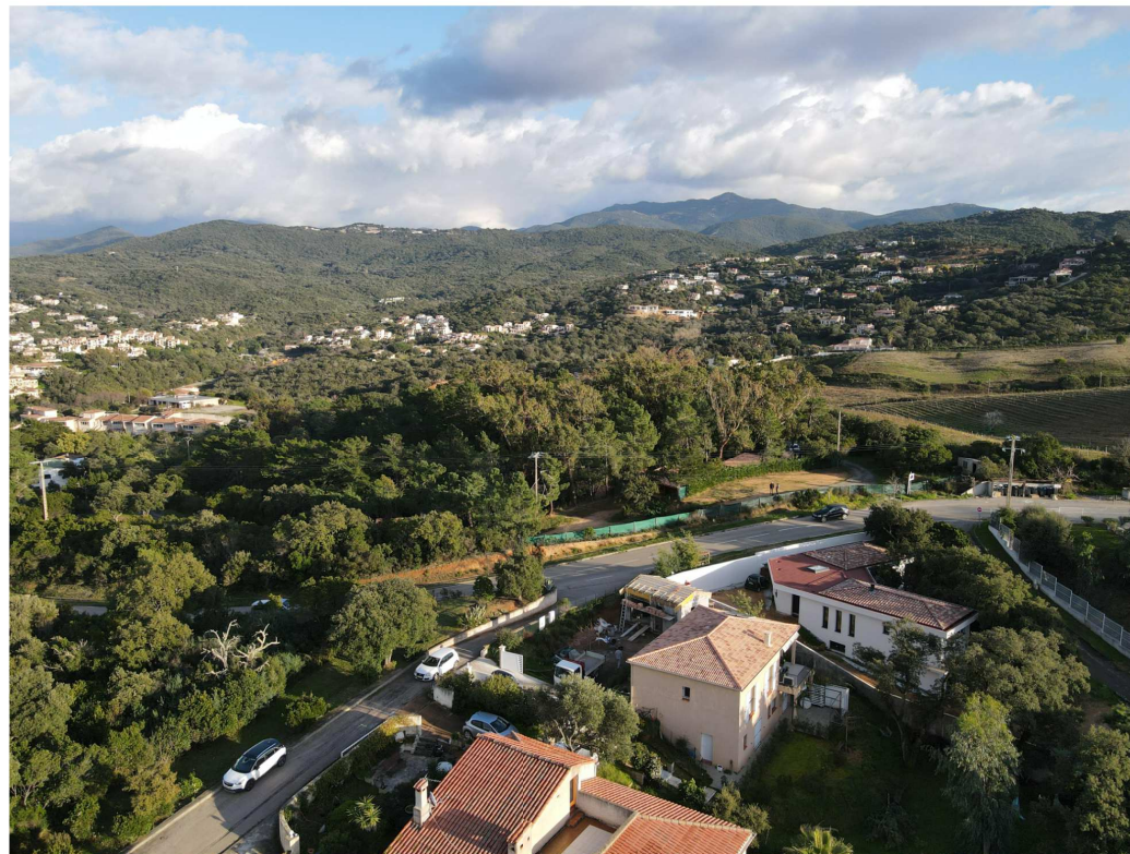
ETAT DES LIEUX