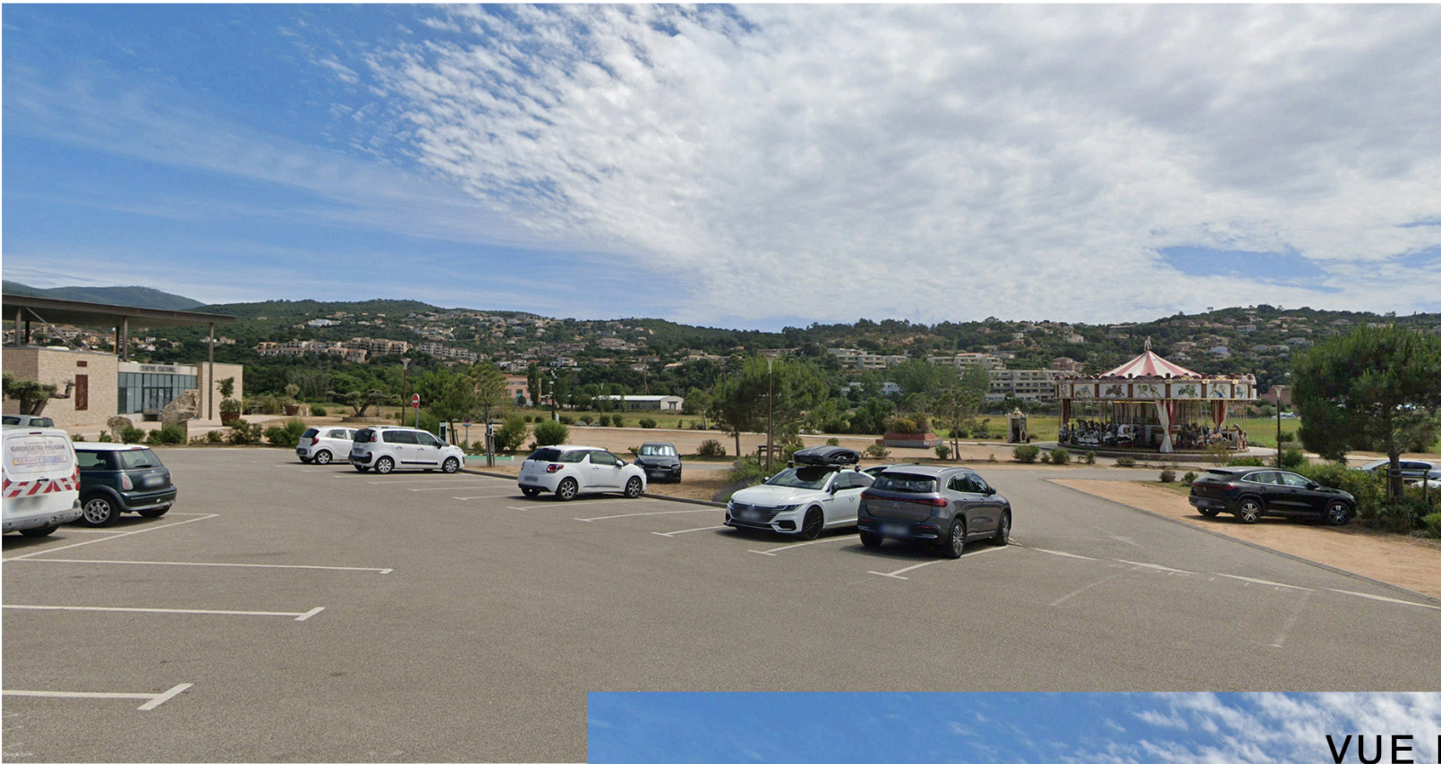
VUE NORD DU PROJET DEPUIS LE BORD DE MER