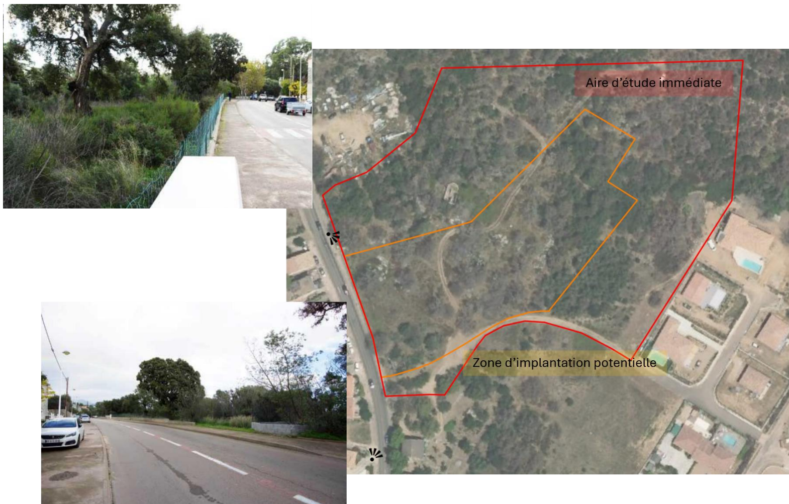
Figure 2 : Photographies et localisation cartographique du projet, Biotope 2025