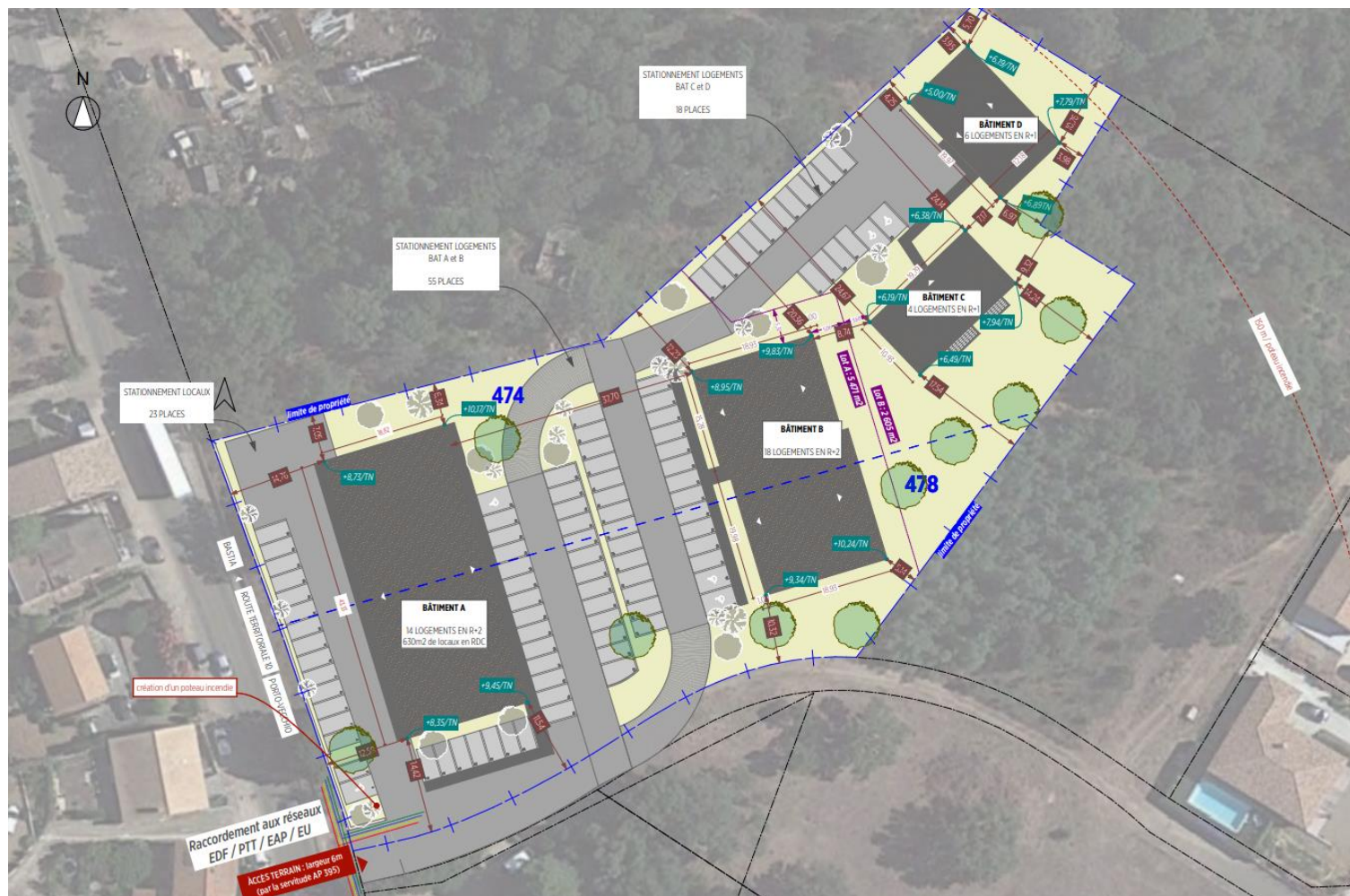
Figure 3 : Plan de masse du projet (source : Alpha architecture)