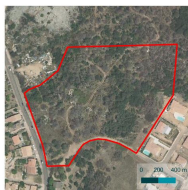
Figure 1 : Plan de situation, Biotopé 2025