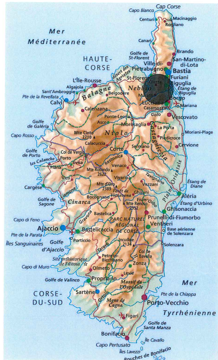
Situation générale Commune de Olmeta di Tuda