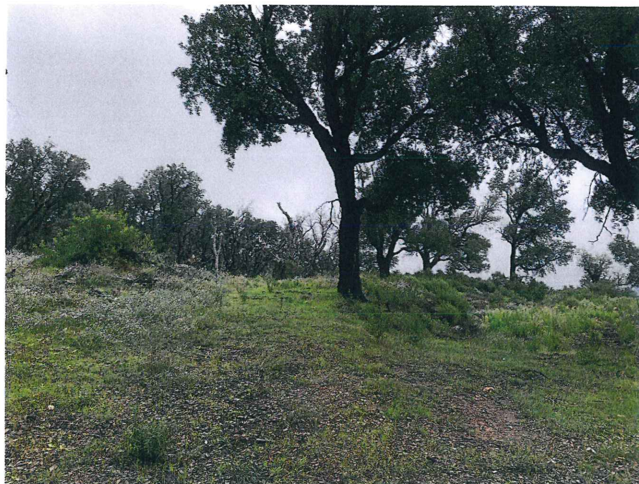
PCMI 7 Terrain dans son environnement proche