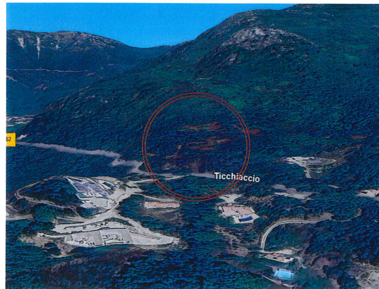
PCMI 8 Terrain dans son environnement lointain