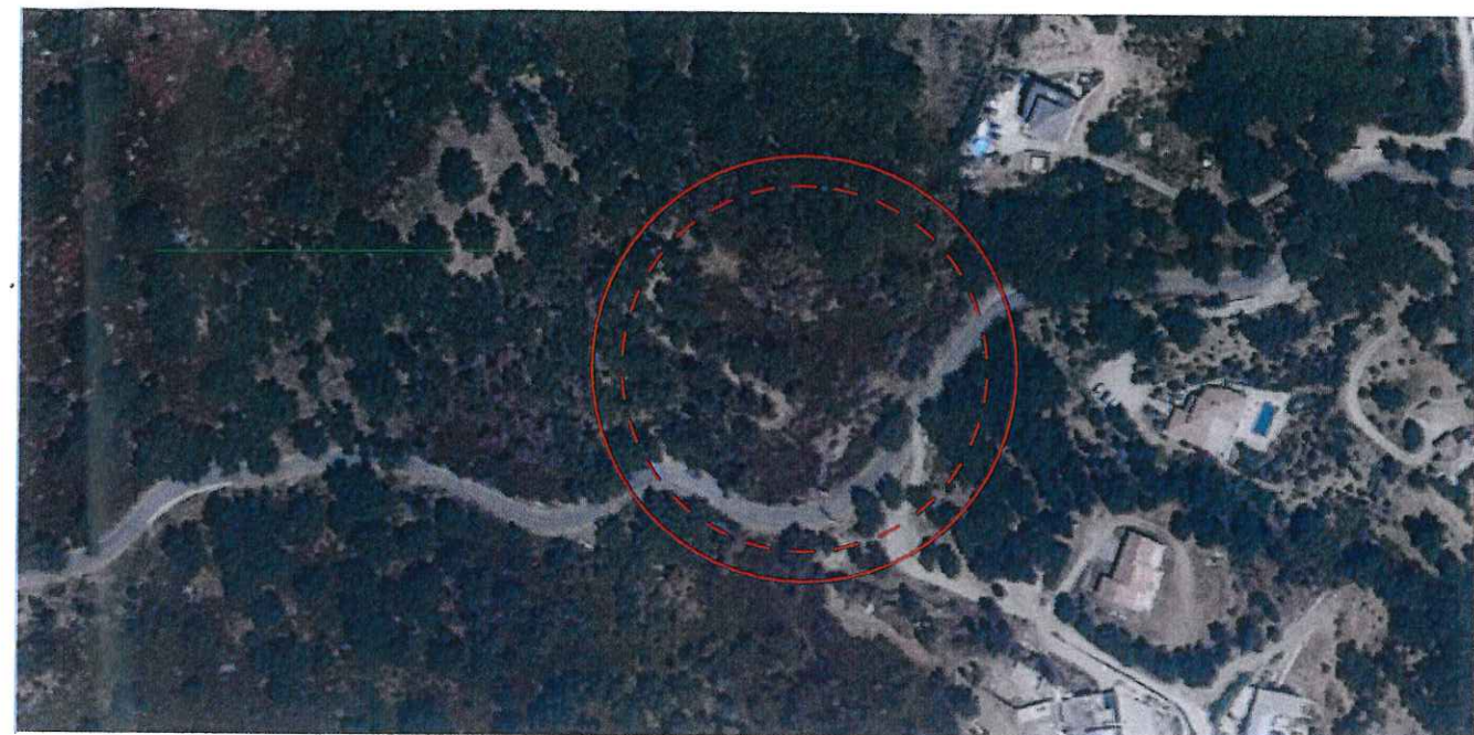
Vue aérienne / Plan de situation du terrain