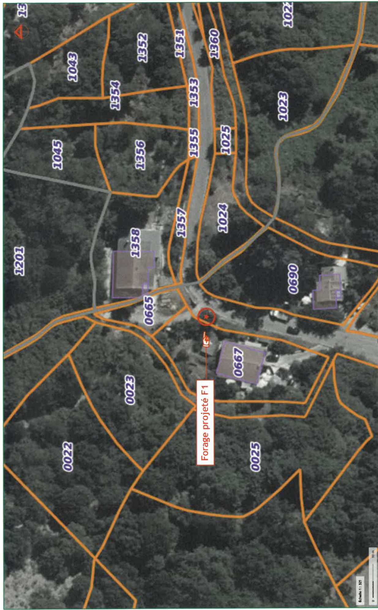
Figure n°2 : Localisation cadastrale du terrain d'assiette du projet de forage F1