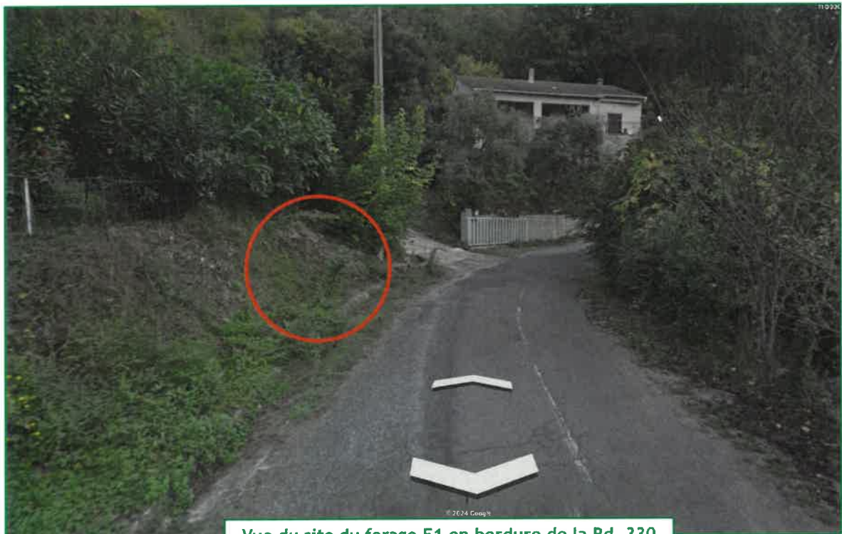
Vue du site du forage F1 en bordure de la Rd. 330