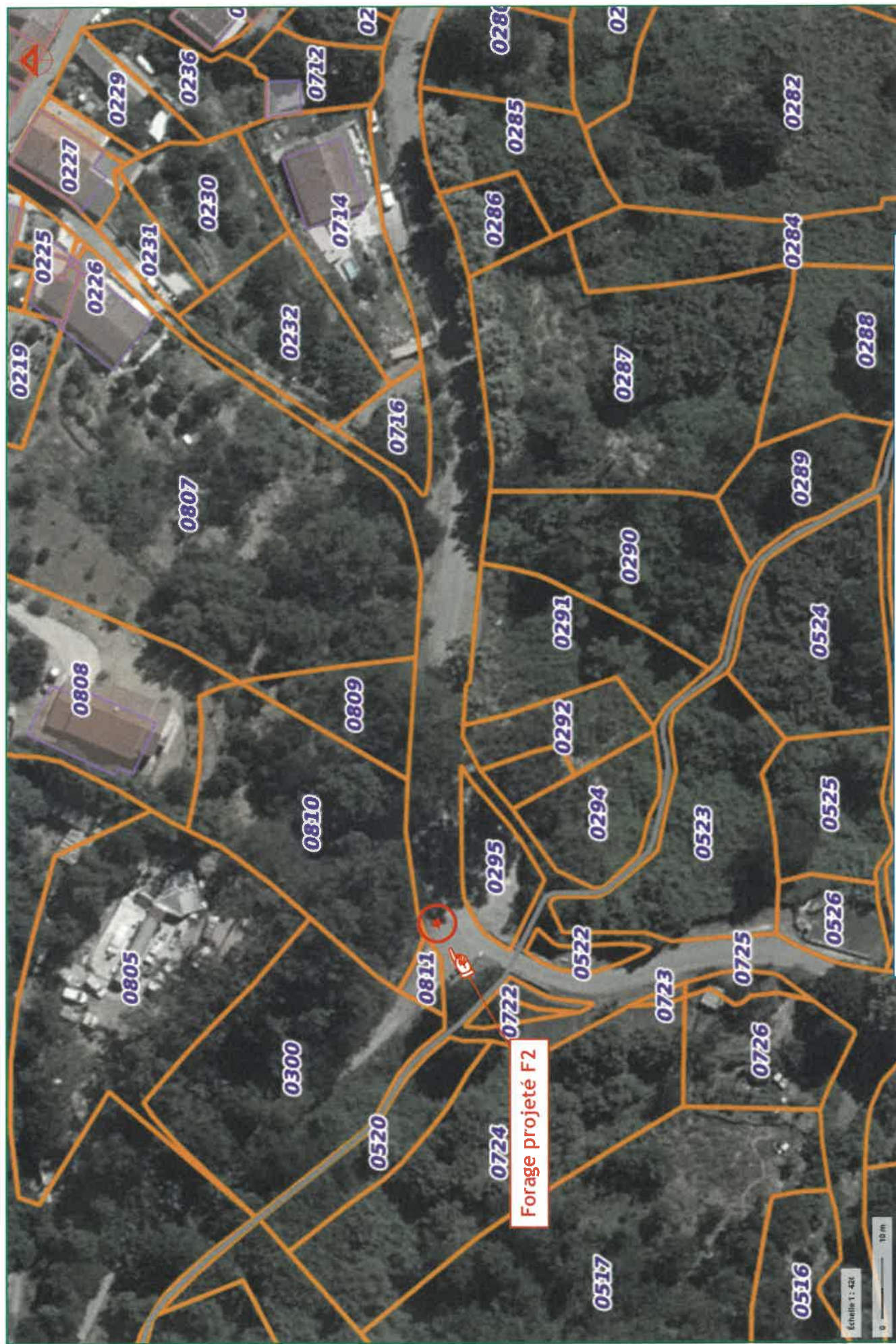
Figure n° 3 : Localisation cadastrale du terrain d'assiette du projet de forage F2