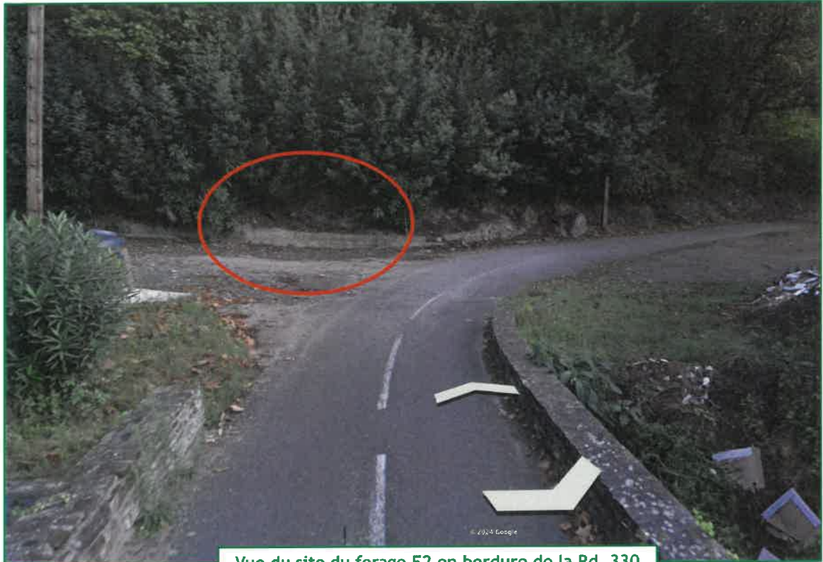
Vue du site du forage F2 en bordure de la Rd. 330