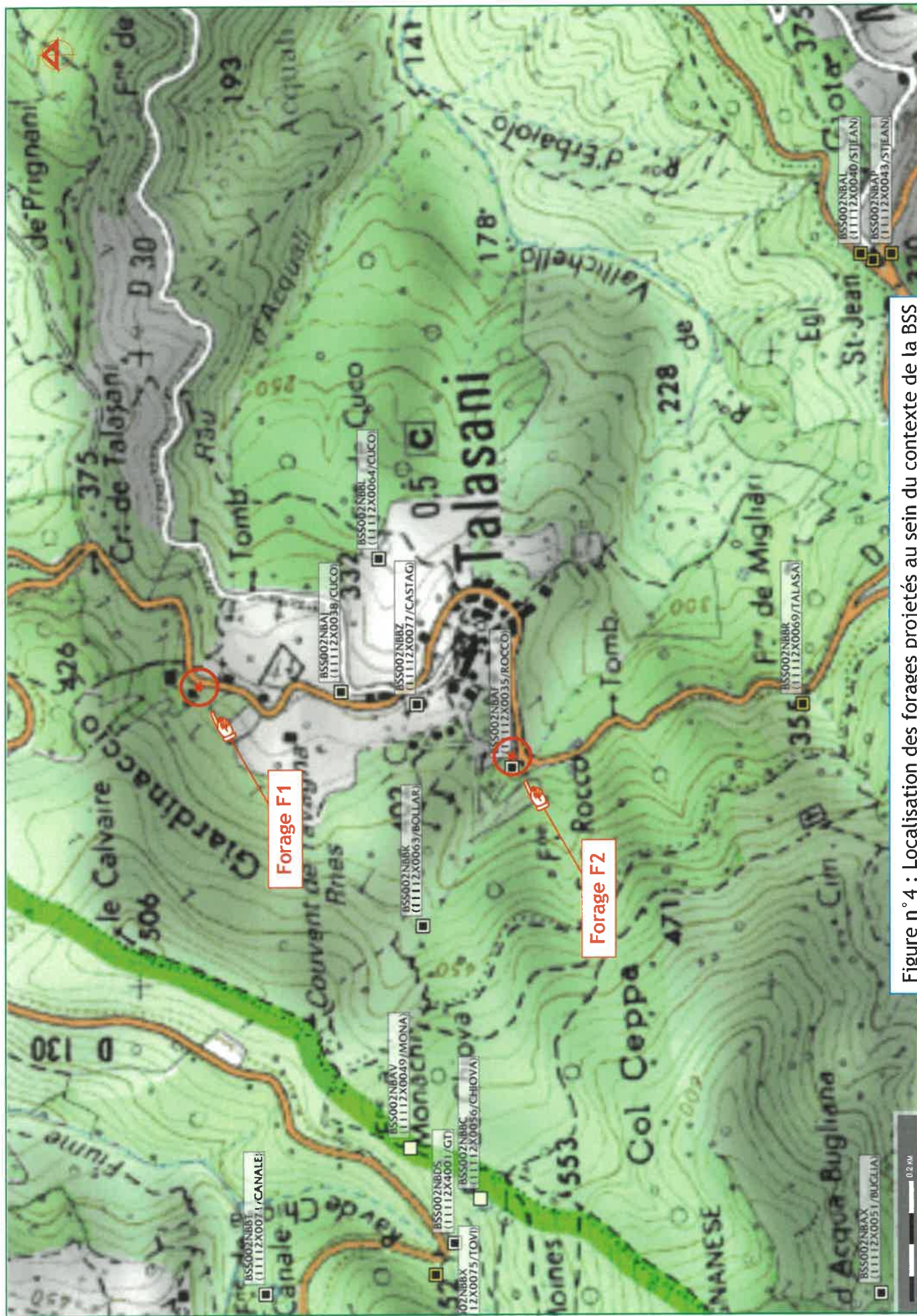
Figure n°4 : Localisation des forages projetés au sein du contexte de la BSS