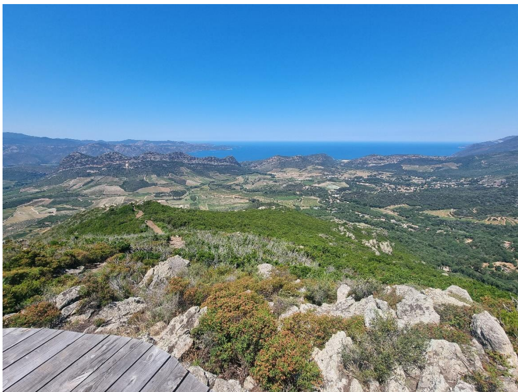
dessous photomontage avec intégration de vignes