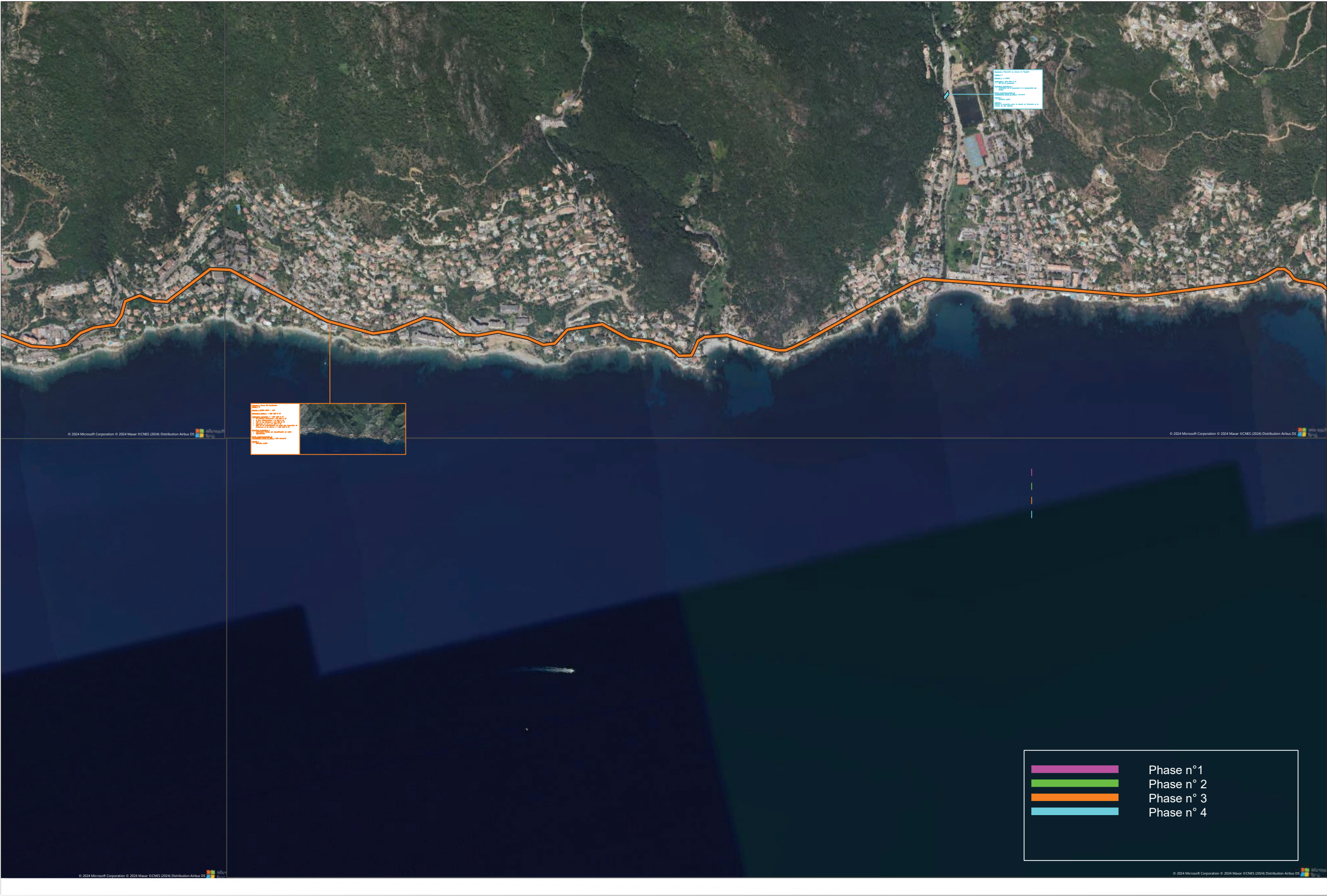
Annexe 4 : Cartographie des tronçons - partie 4