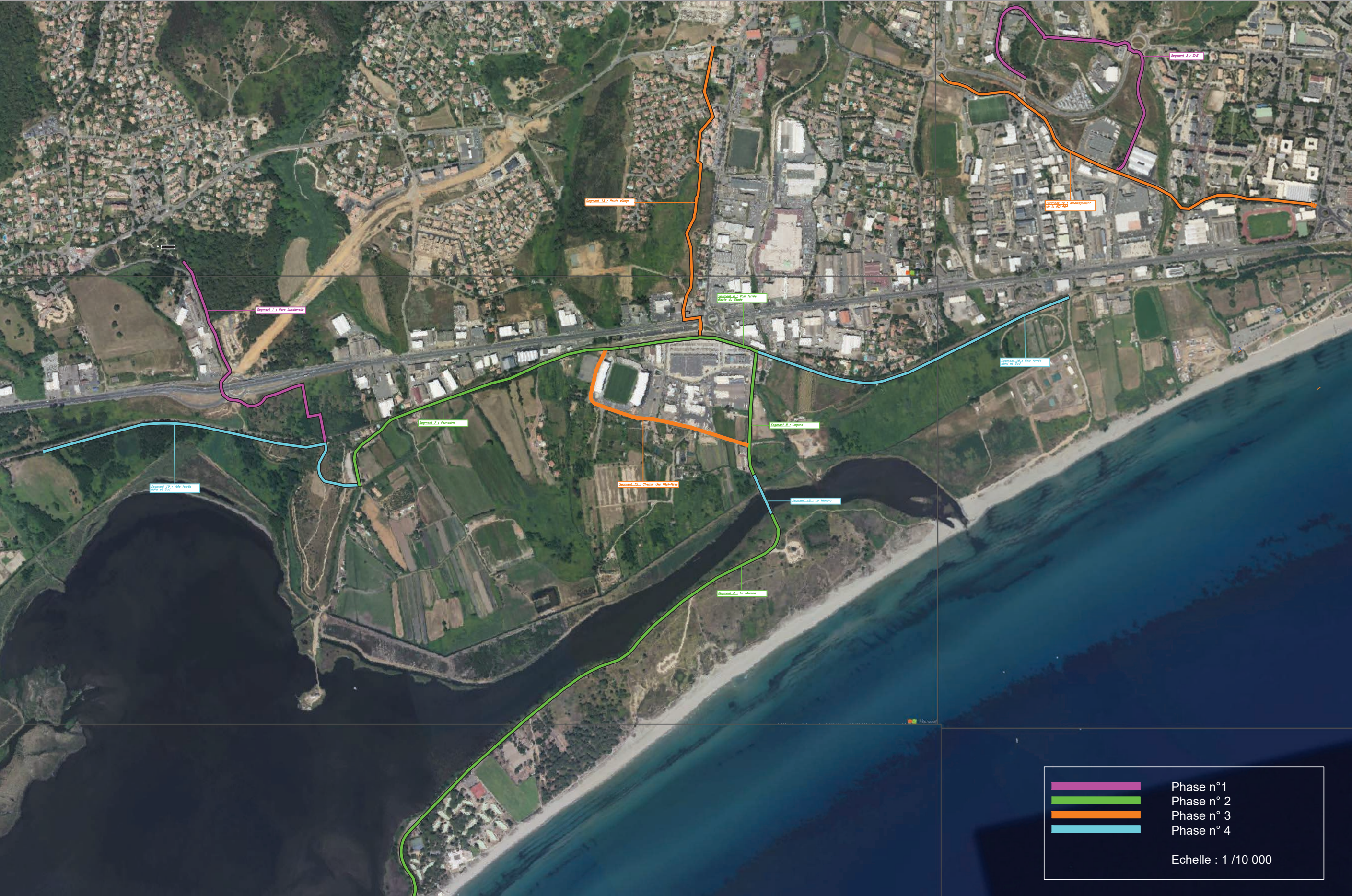
Annexe 4 : Cartographie des tronçons - partie 1