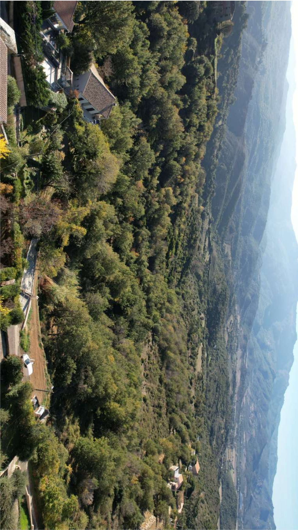
PCM18 - ENVIRONNEMENT LOINTAIN