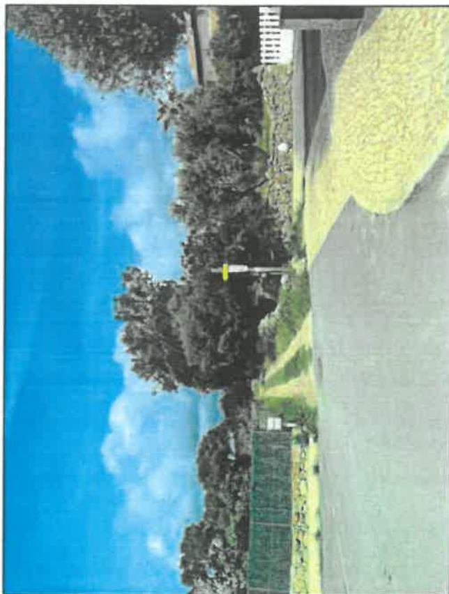
PA 6 - PHOTOGRAPHIE DU TERRAIN DANS L'ENVIRONNEMENT PROCHE