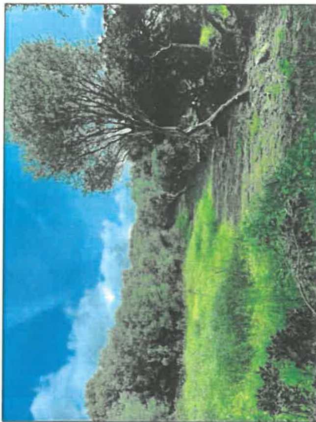
PA 7 - PHOTOGRAPHIE DU TERRAIN DANS LE PAYSAGE LOINTAIN