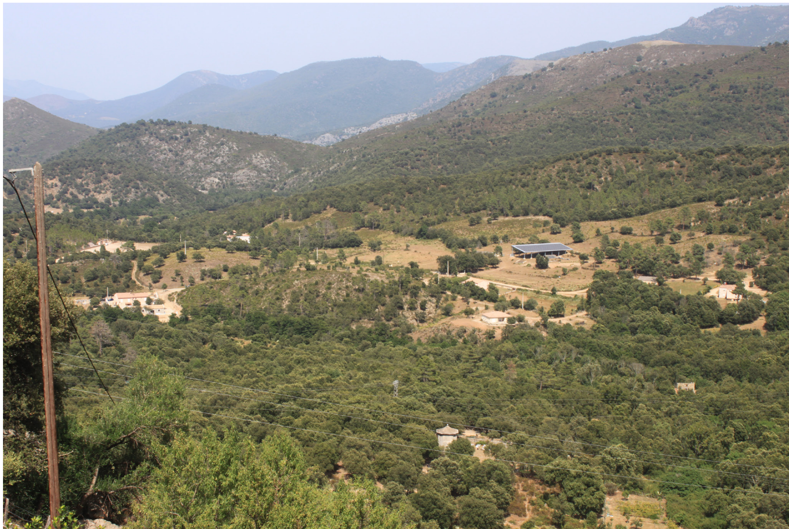
Annexe 3b : Photographie n°1 prise depuis le village de Castirla