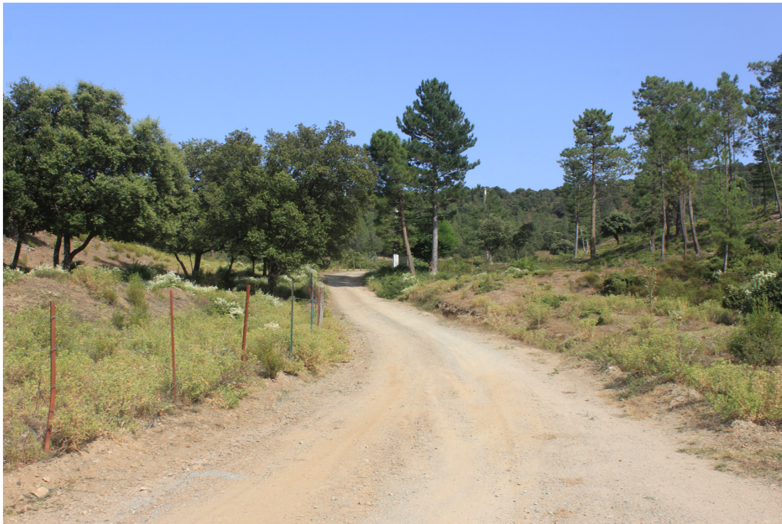
Annexe 3b : Photographie n°2 prise depuis le projet représentant l'environnement type rencontré