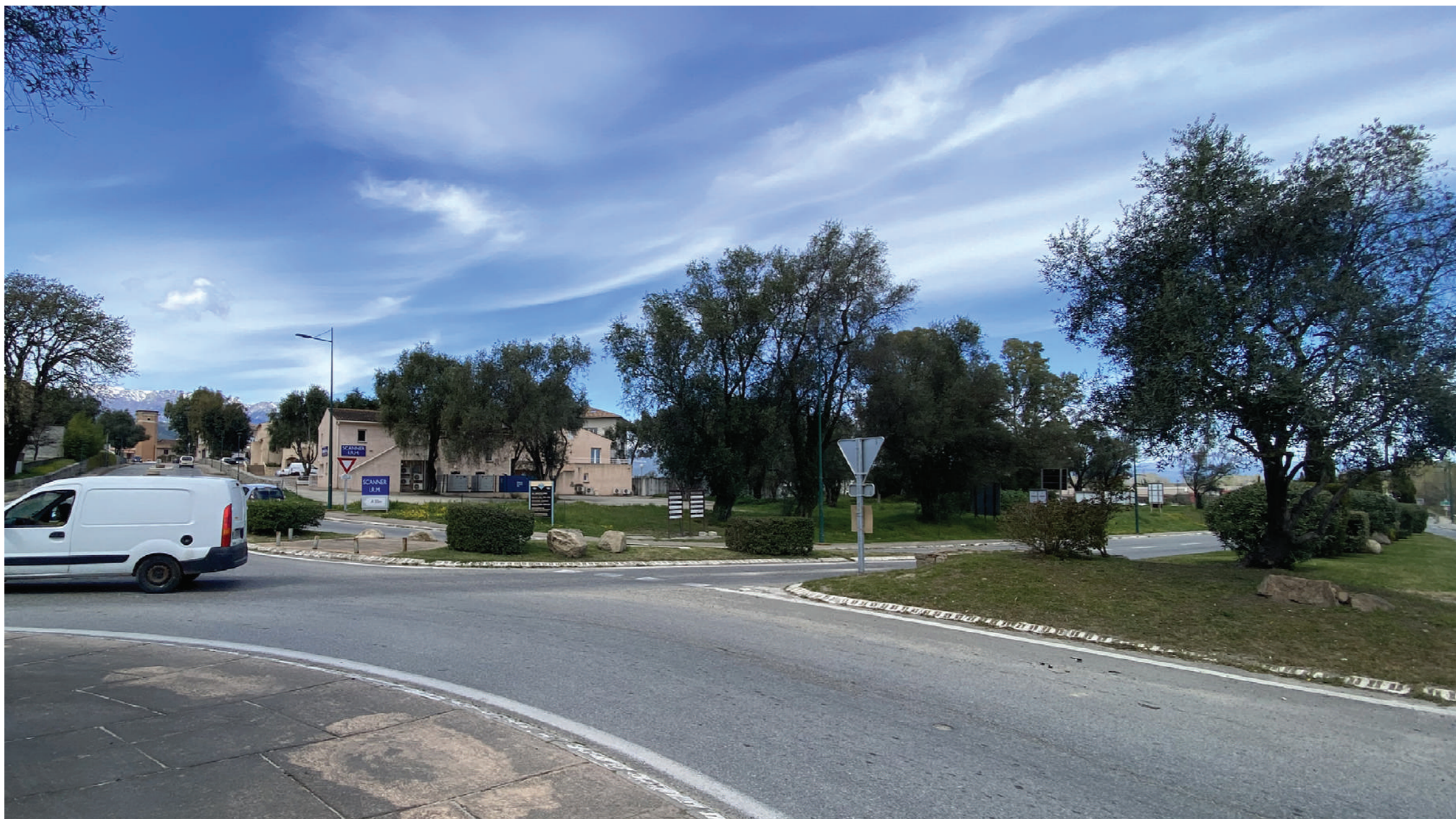
Vue depuis le Rond Point de Migliacciaru vers le Nord Ouest