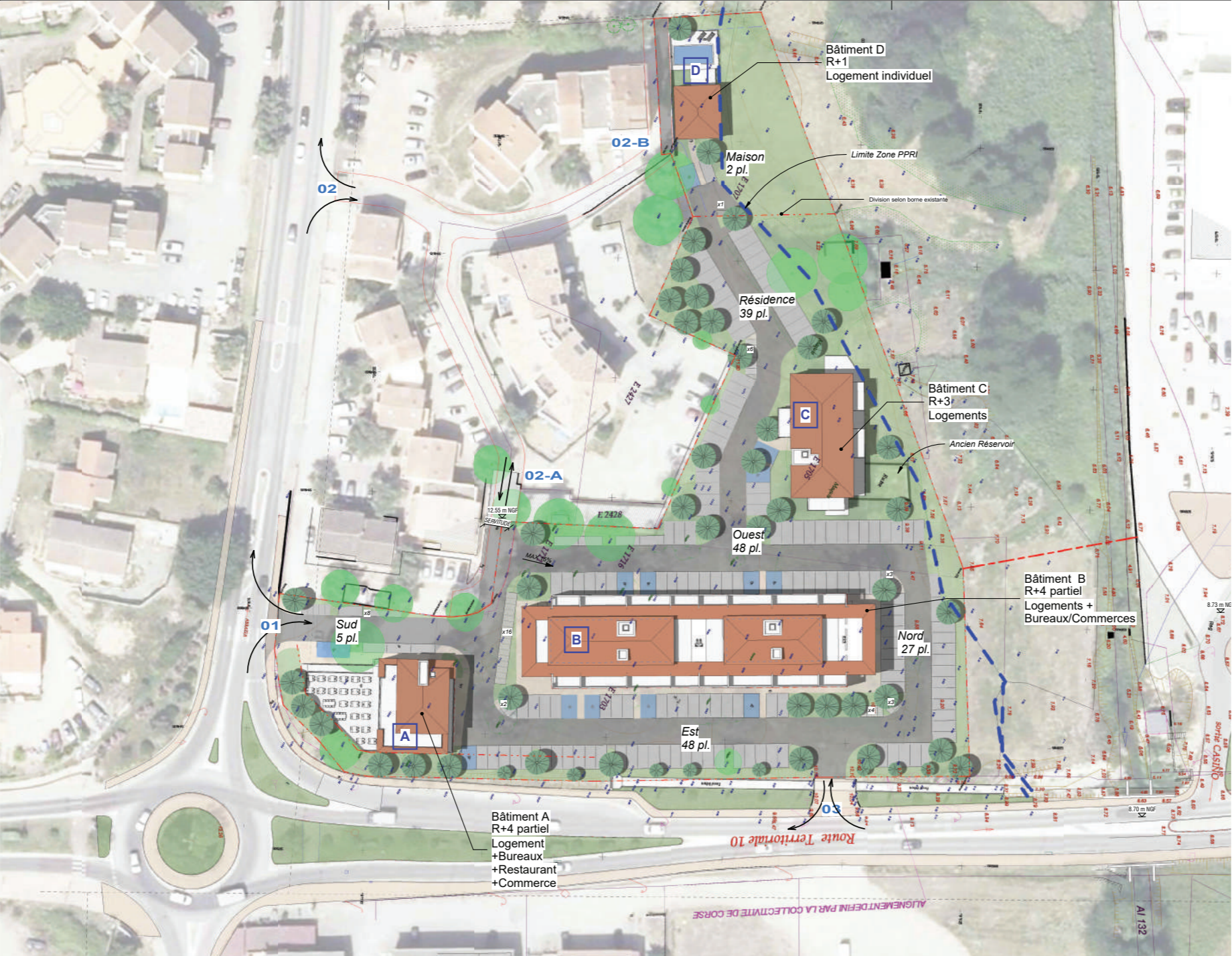
Annexe 4 : Plan de masse