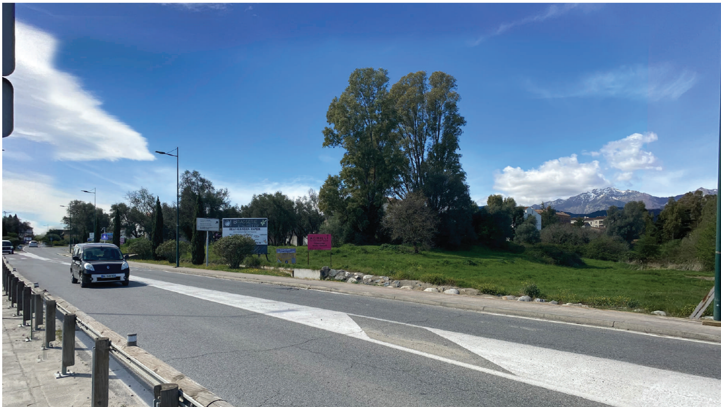
Vue depuis la RT10 au niveau du ruisseau vers le Sud Ouest