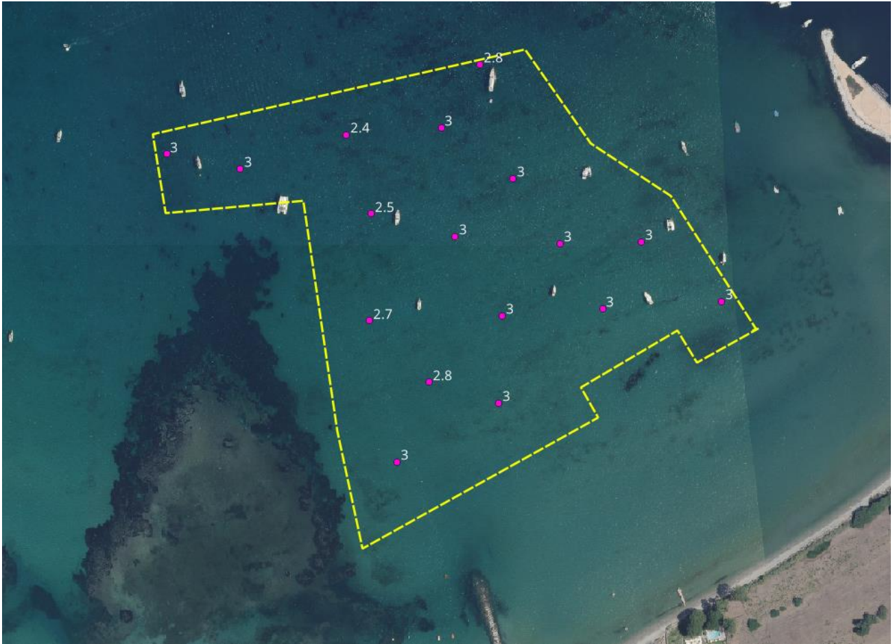
Figure 2 : Résultat des études de lançages (ICTP 2023)

Enfin, il est joint au document, un fichier SIG du projet de ZMEL de Saint florent. Celui-ci contient :