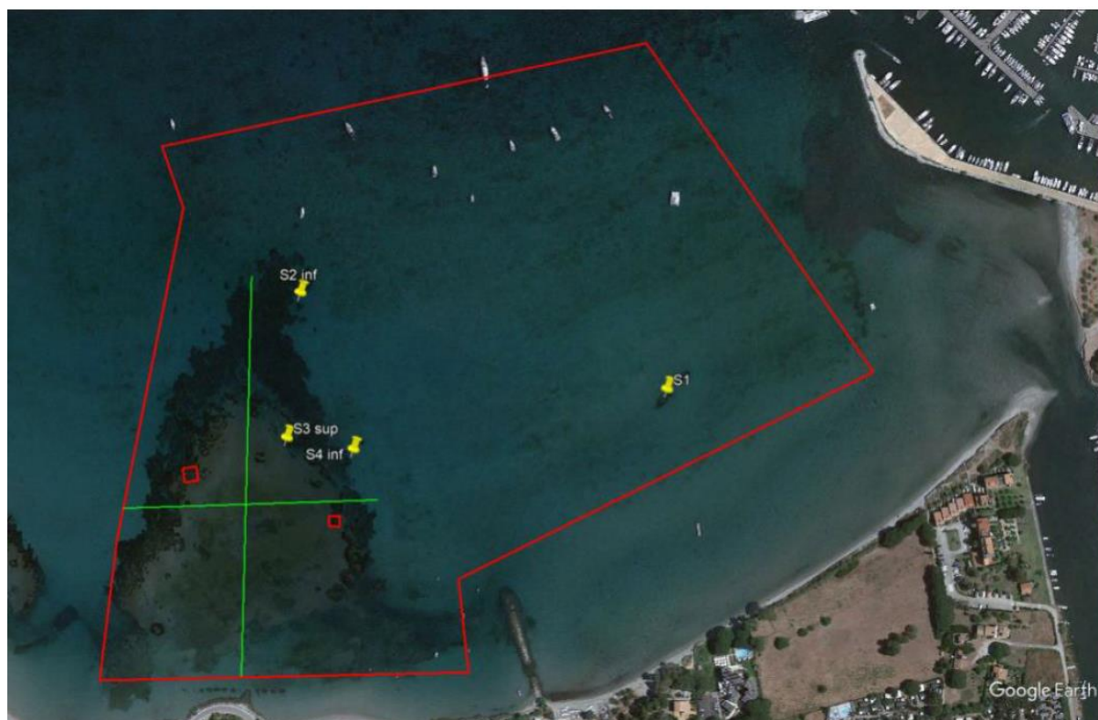
Figure 3 : Proposition d'implantation des stations, transect et carrés permanents virtuels