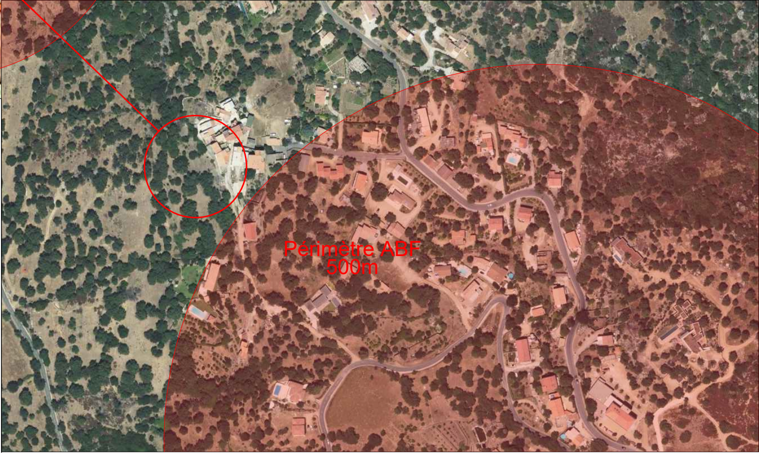
2 Vue aérienne