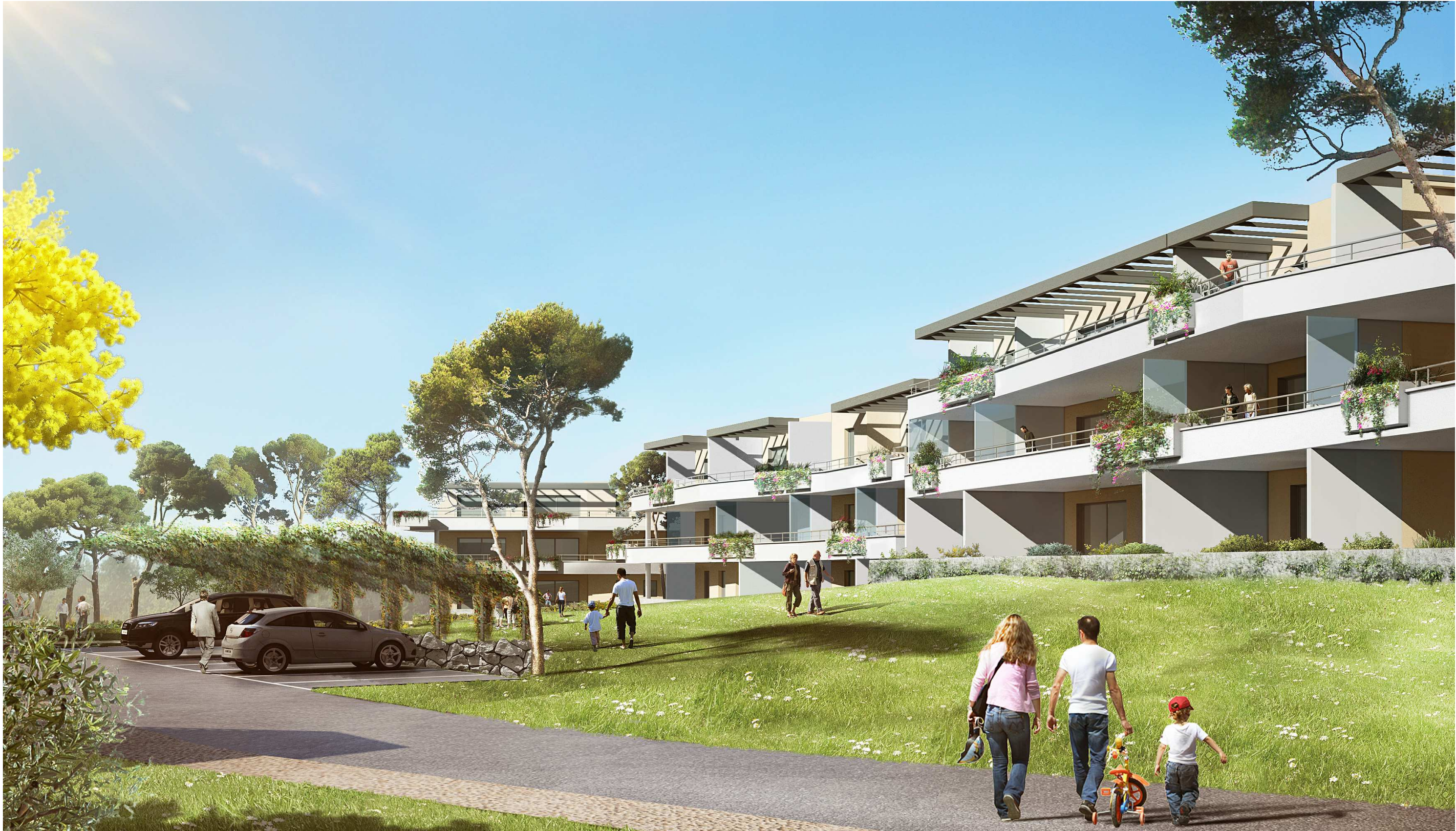
Vue depuis les bâtiments 10 et 11

C:\PROJETS\119\Porticcio\119 Porticcio_Ext 27/06/2012 11:538