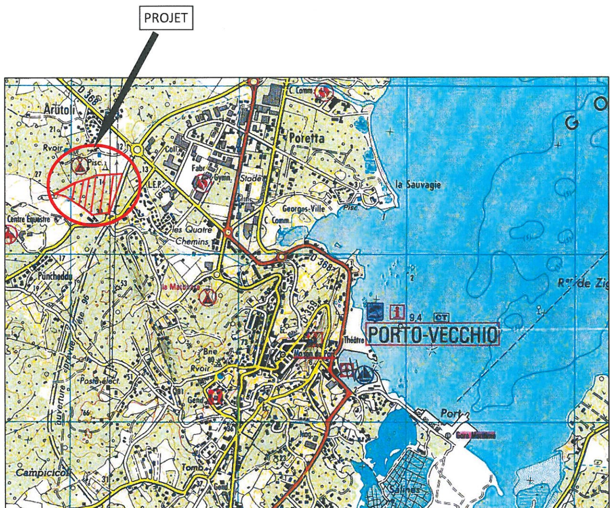
PLAN DE SITUATION – EXTRAIT IGN