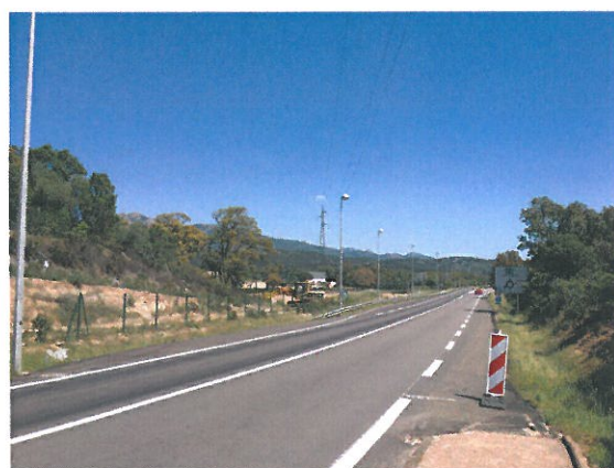
Vue du terrain depuis la RN 198 (située à l'Est)