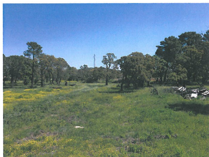
Vue du terrain depuis sa limite Ouest