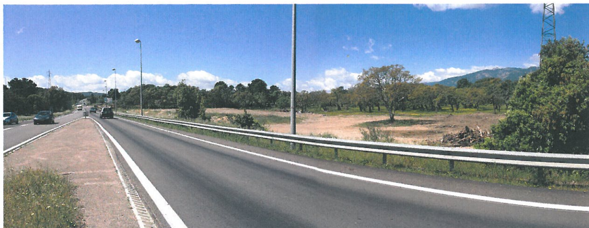
Vue du terrain depuis la RN 198 (située à l'Est)