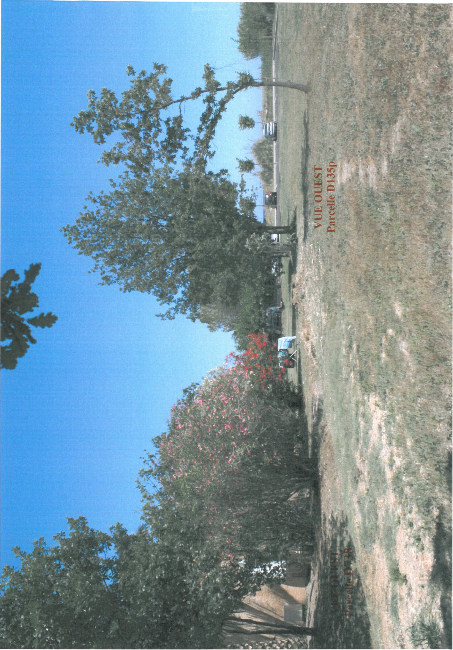
VUE OUEST Parcelle D135p