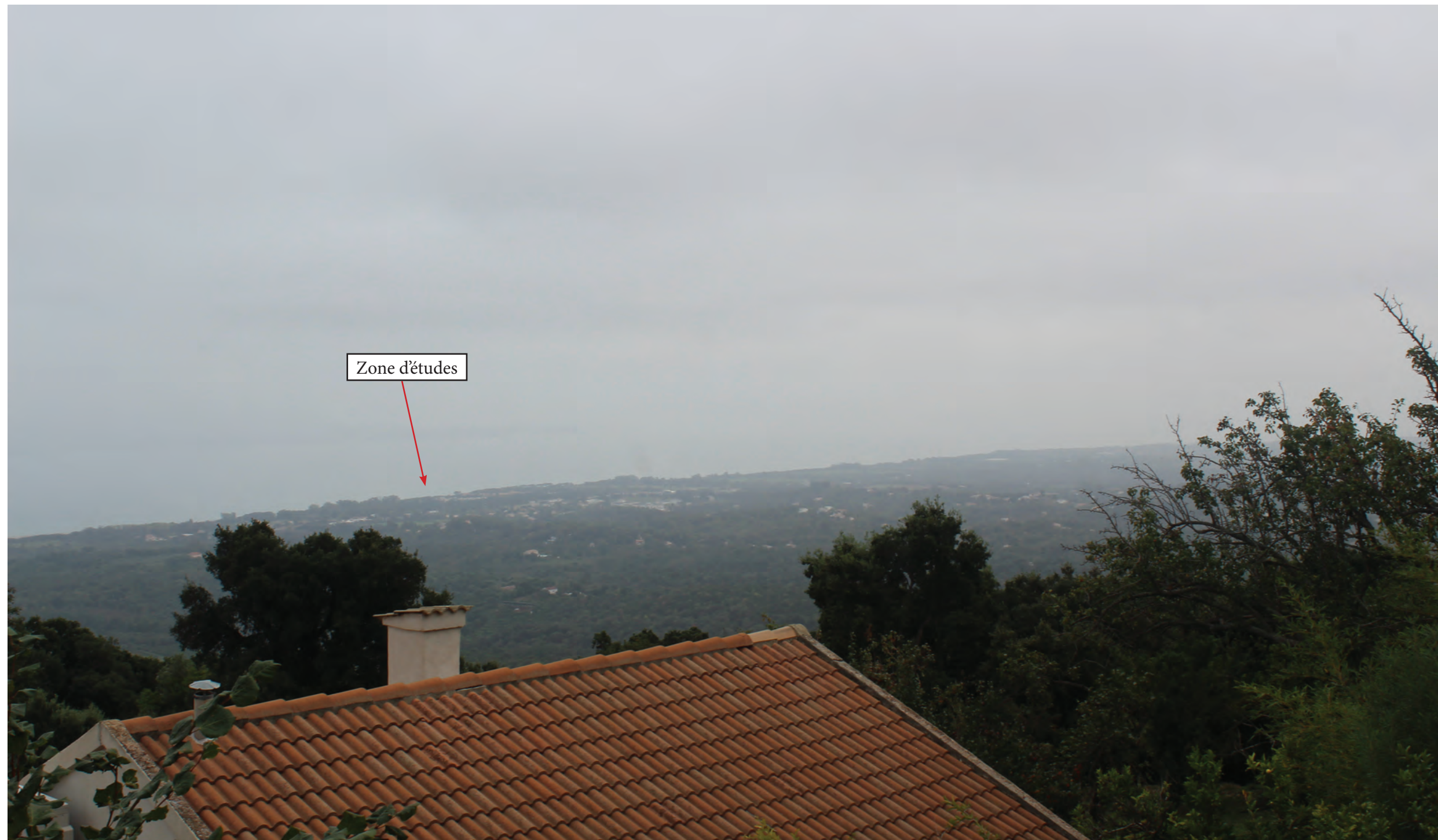
Annexe 3c : Photographie n°2 prises depuis le village de Santa-Maria-Poggio