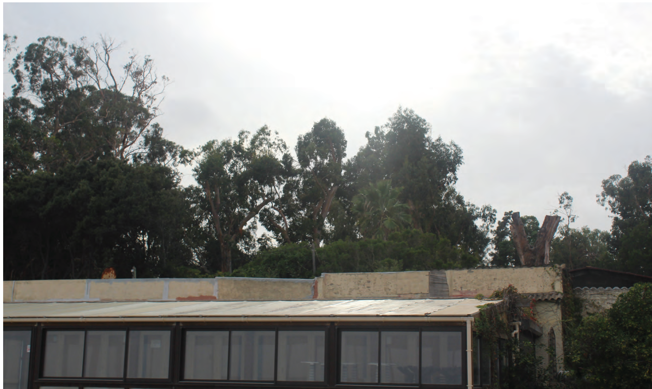
Annexe 3b : Photographie n°1 prise depuis la plage à l'Est de la zone d'études