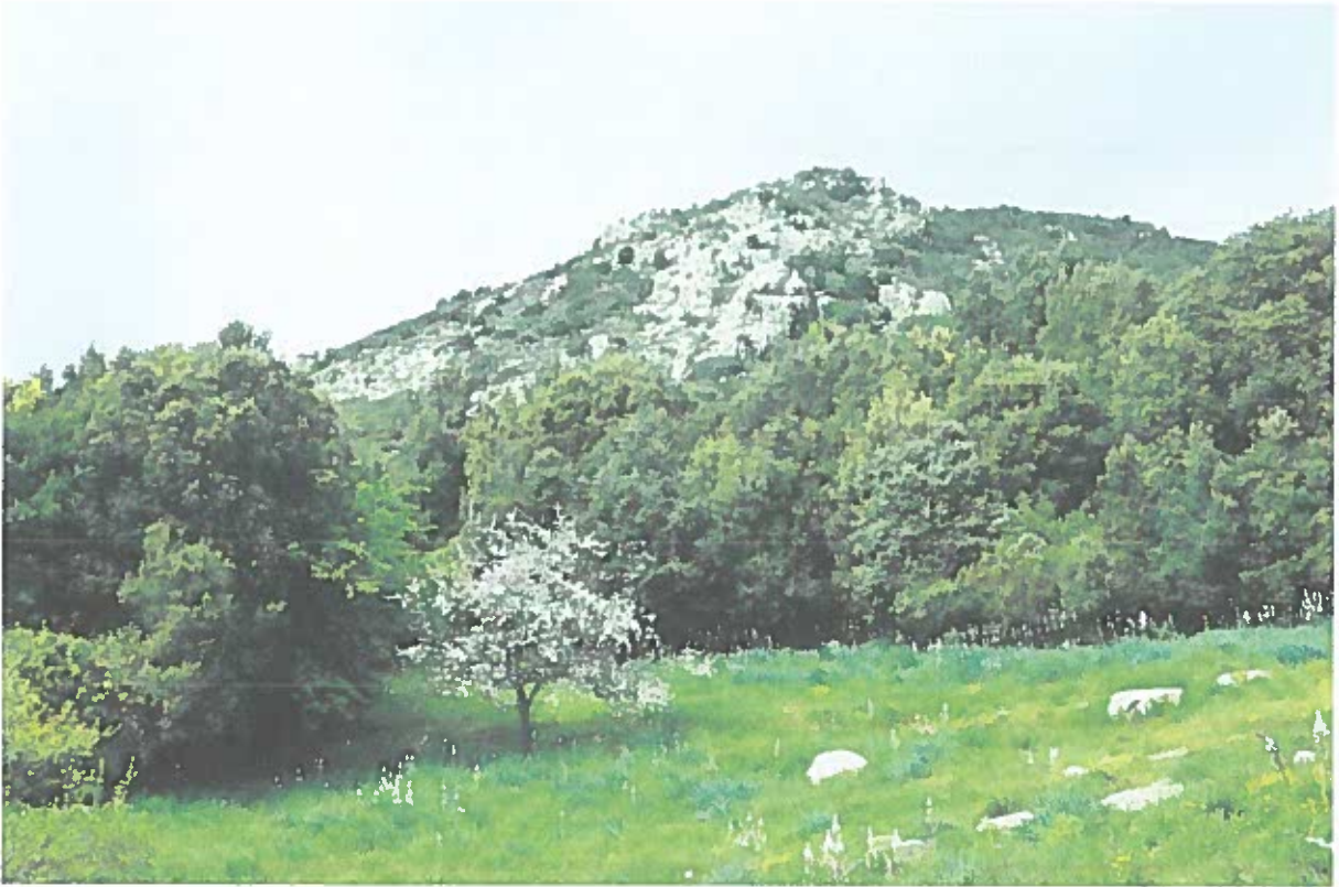
Le site d'implantation de SR 7 (à proximité du pommier en fleurs).