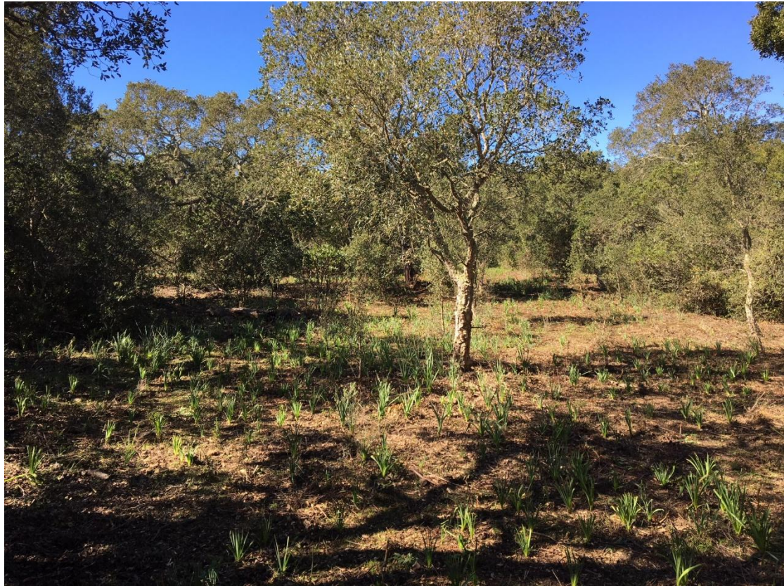
Prairies avec îlots d'arbustes et maquis dense