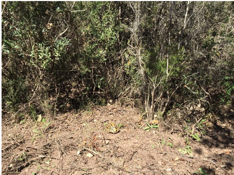
Tortue d'Hermann en solarium dans une zone démaquée