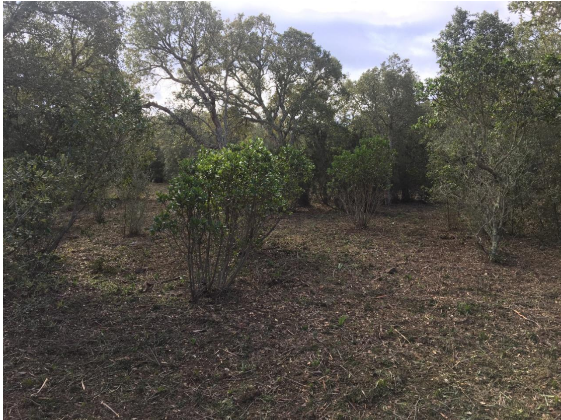
Prairies avec îlots d'arbustes