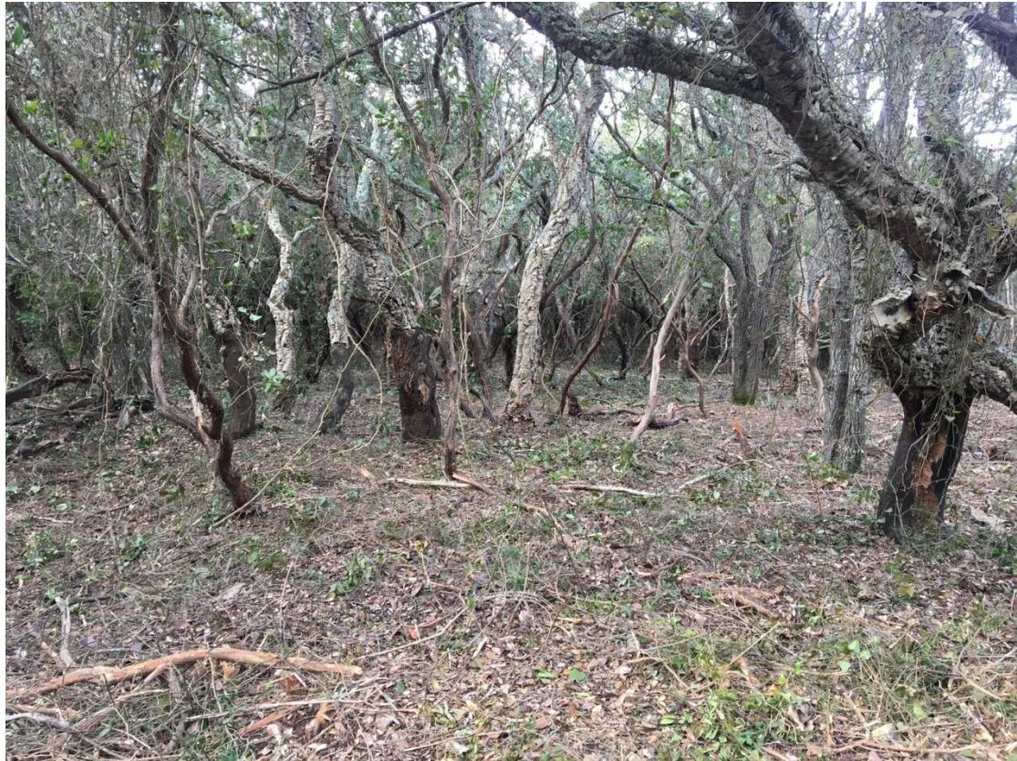
Sous bois démaquisé