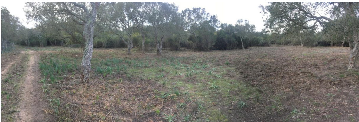
Prairies avec îlots de maquis