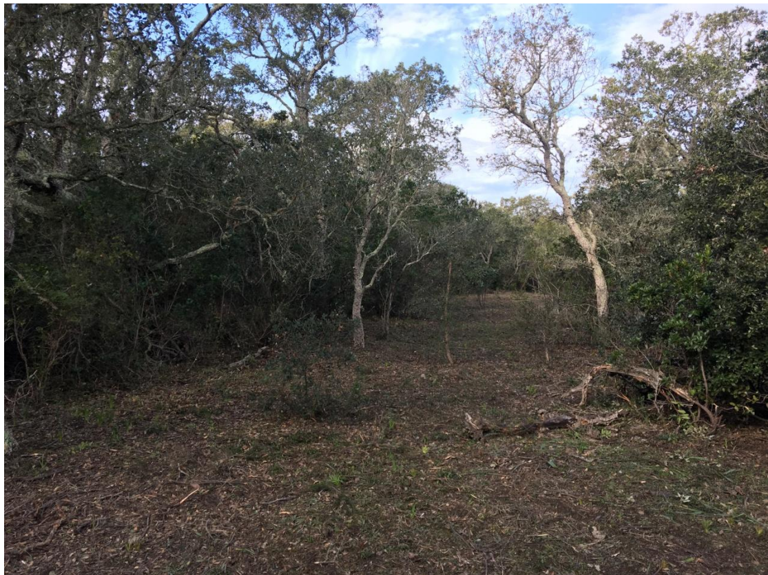
Milieus ouverts (prairies) et fermés (maquis dense)