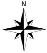
PLAN DE SITUATION Ech 1/2000

AGOA ARCHITECTURE N° National S17374 - Régional Lan S01777 Tel : 06 63 63 47 99 agoa.architecture@gmail.com