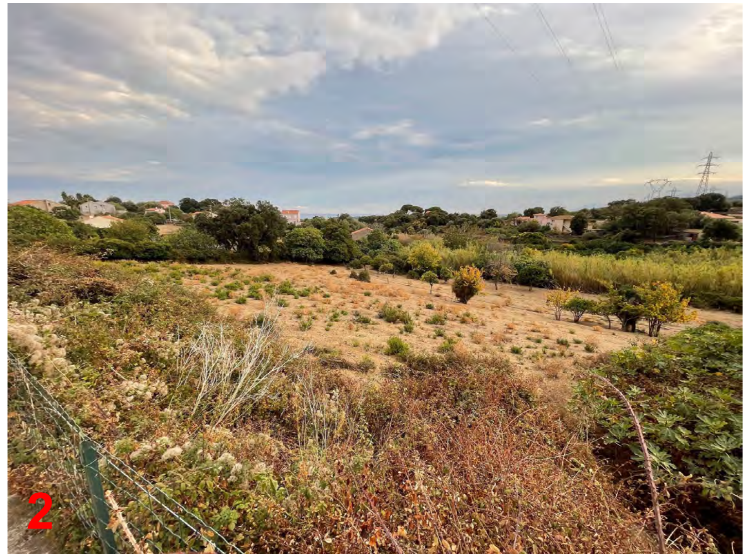
Photographies datant de Novembre 2021 Vues du terrain depuis la voie d'accès, chemin de Corbaja Sottana