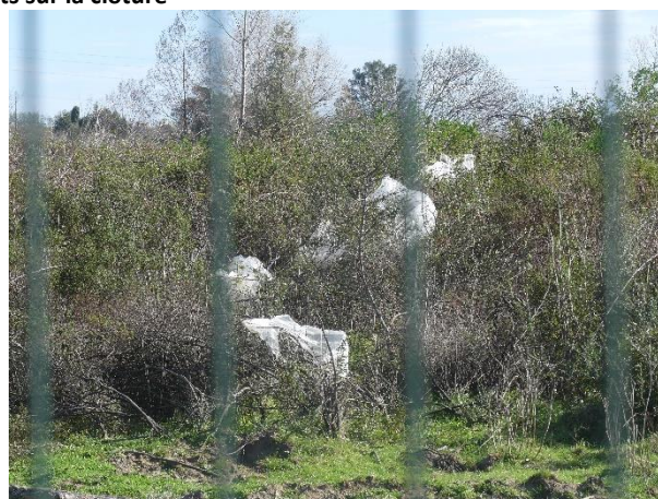
Déchets envolés en dehors des emprises à retirer rapidement