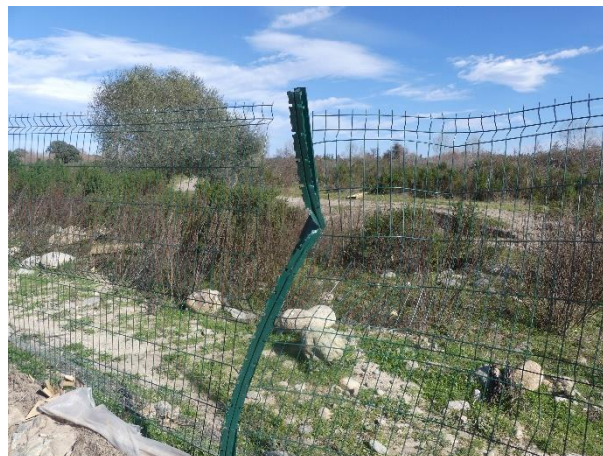
Nouveaux impacts sur la clôture