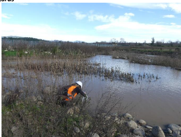
Relâcher des têtards dans une mare temporaire située en dehors des emprises

J. JALABERT, 11/02/2020, Poggio-di-Nazza (2B)