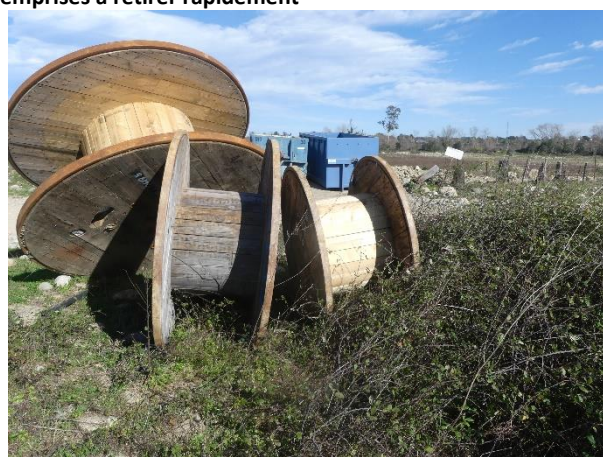
Rouleaux débordant dans les ronciers et à déplacer

J. JALABERT, 11/02/2020, Poggio-di-Nazza (2B)