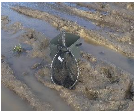
Matériel utilisé pour la capture et le stockage temporaire des têtards

L'opération a été effectuée par deux écologues spécialisés en batrachologie le 11 février 2020. Les têtards ont été capturés à l'aide d'épuisettes et ont été disposés dans des bacs remplis d'eau le temps d'une intervention sur une ornière. Les individus capturés ont ensuite été relâchés dans une mare temporaire située en dehors des emprises.