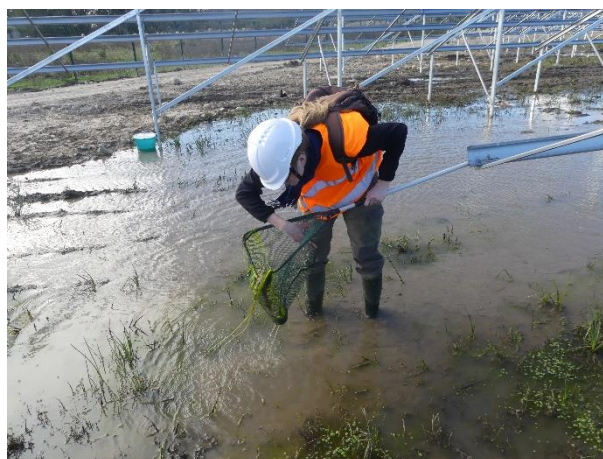
Recherche par épuisette de têtards