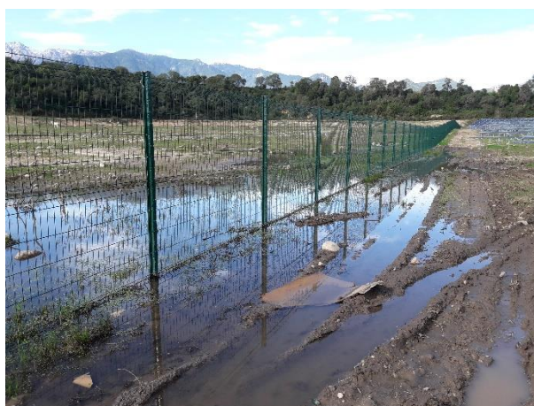
Lieux de capture des têtards (à noter la connection de certaines ornières avec l'espace naturel situé en dehors des emprises)