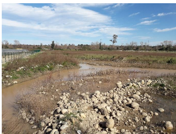
Mare d'accueil pour les têtards capturés lors de l'intervention M. PEZIN, 11/02/2020, Poggio-di-Nazza (2B)