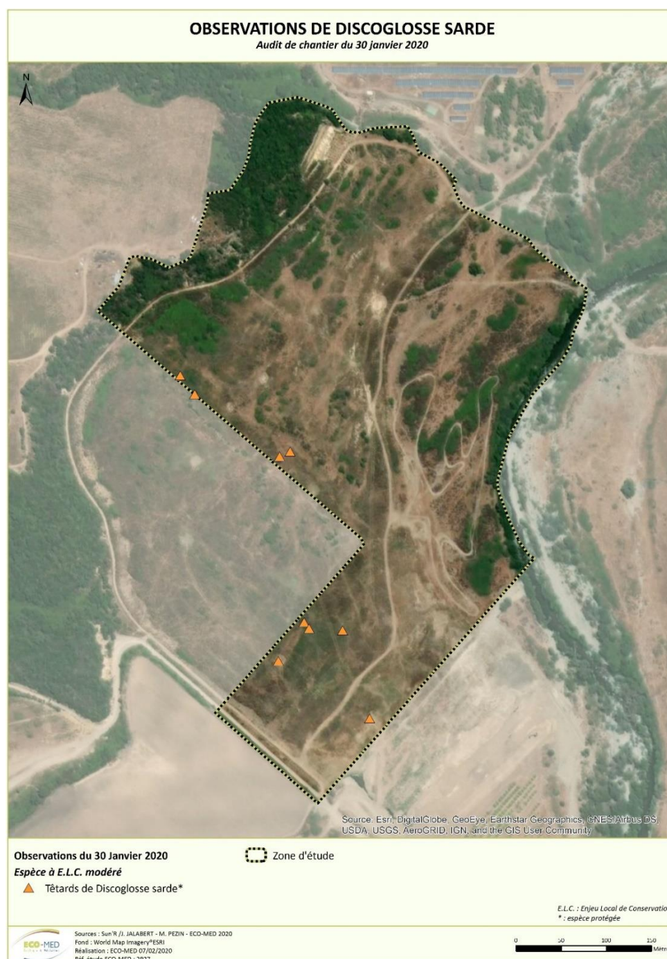
Carte 1 : Localisation des têtards observés lors de l'audit de chantier de janvier

La zone d'intervention se focalise dans les emprises du projet et plus précisément sur les ornières dans lesquelles des têtards de Discoglosse sarde ont été observés lors de l'audit de chantier de janvier 2020 (Réf : 2001-CR2927-AMO-SUNR-POGGIO2B-V1).