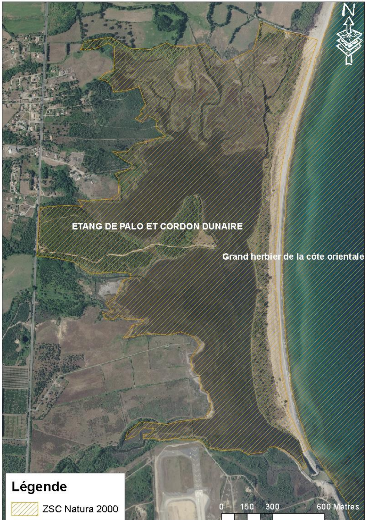
Carte 7 : Carte des zones natura 2000