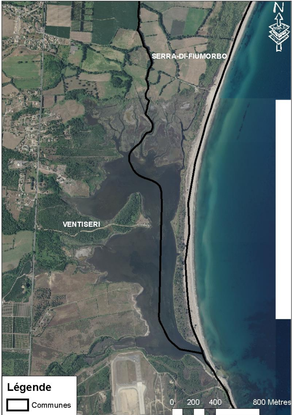
Carte 3 : Etang de Palu, communes de Ventiseri et Serra di Fiumorbu