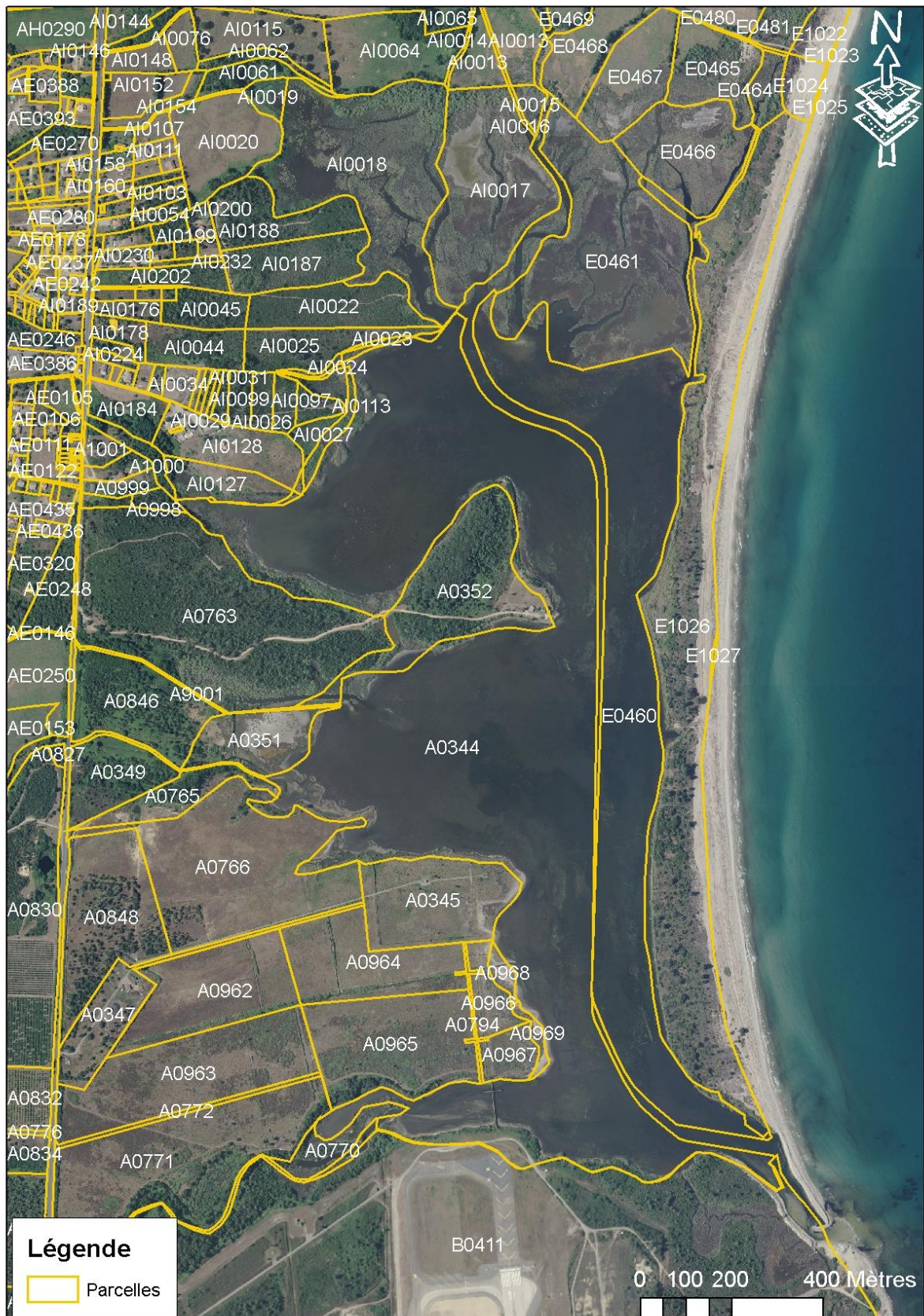
Carte 4 : Relevé des parcelles cadastrales sur le site de Palu