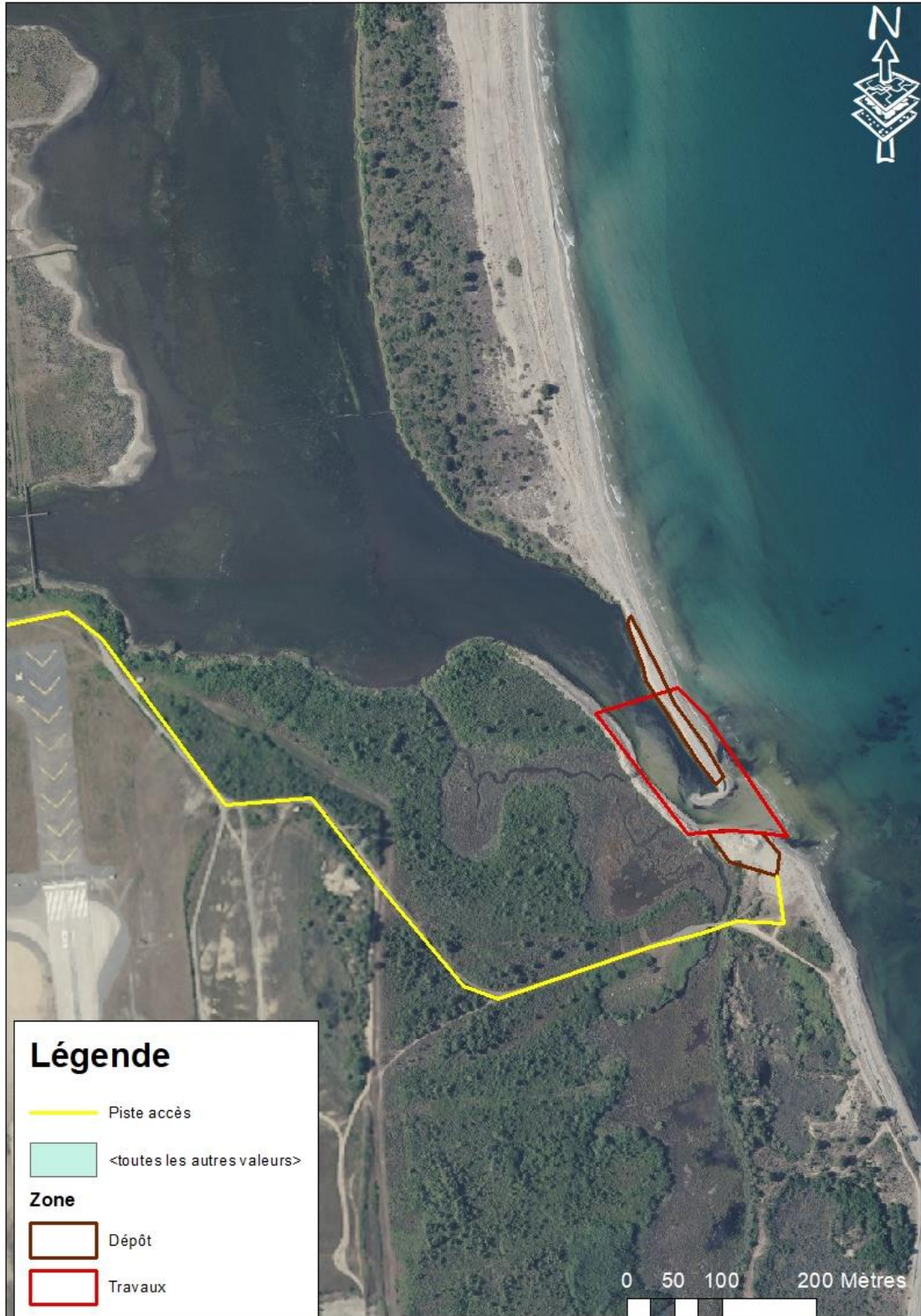
Carte 6 : Carte de la zone de travaux et de l'accès