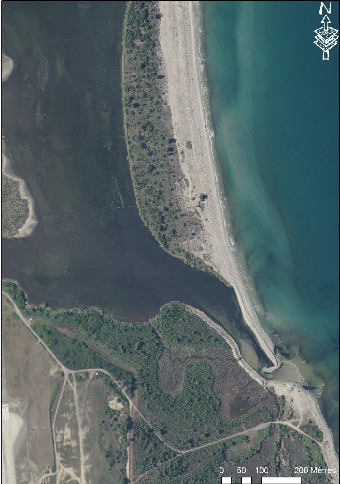
Carte 5 : Zoom sur l'embouchure de l'étang de Palu.