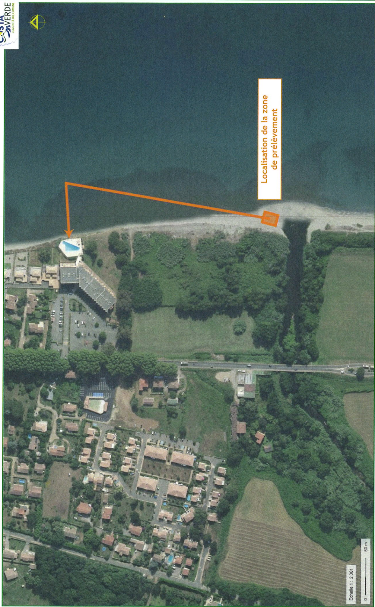
Figure n ° 4 : Localisation précise de la zone de prélèvement de sable