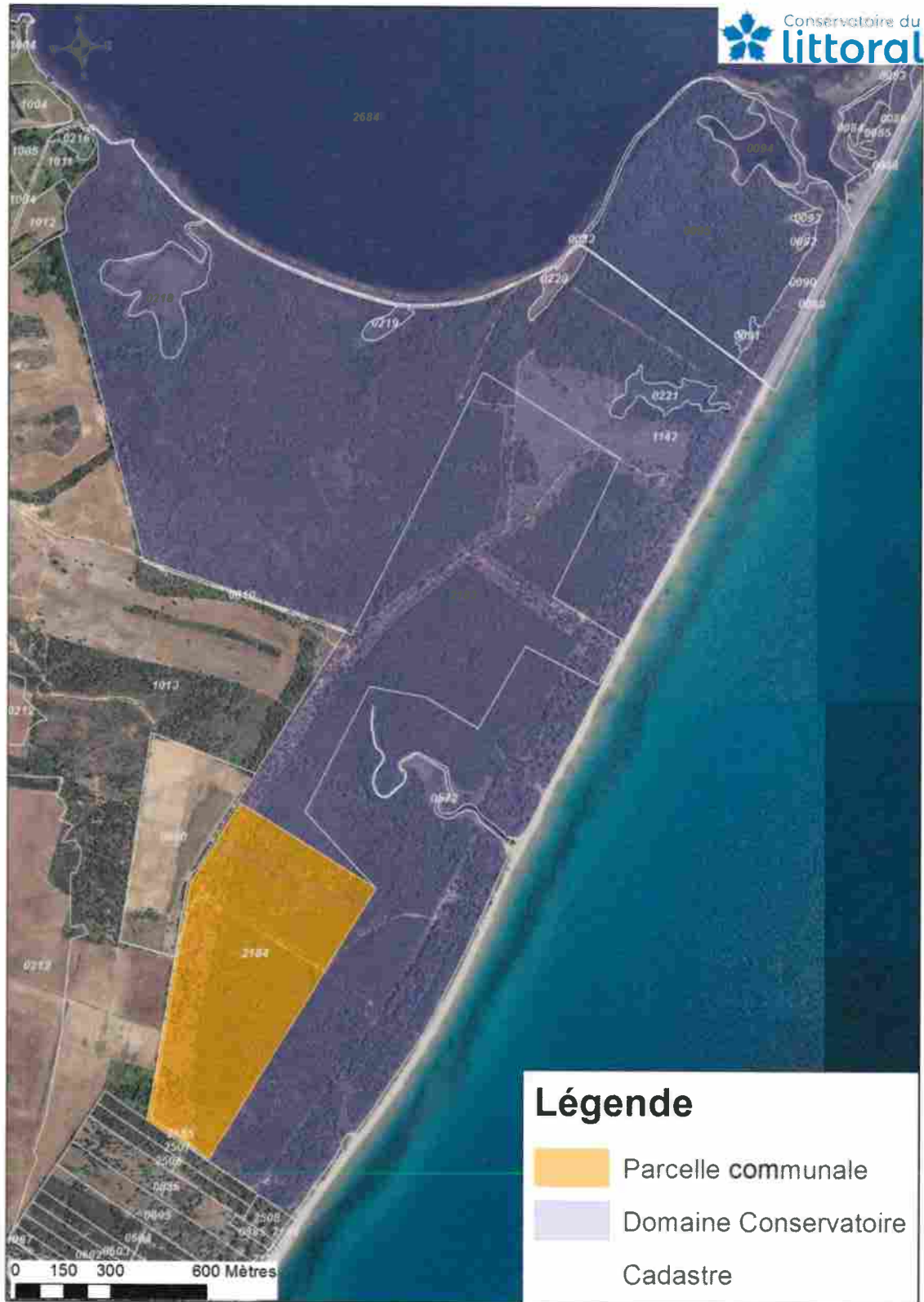
Site de Pinia : Domaine du Conservatoire et parcelle communale