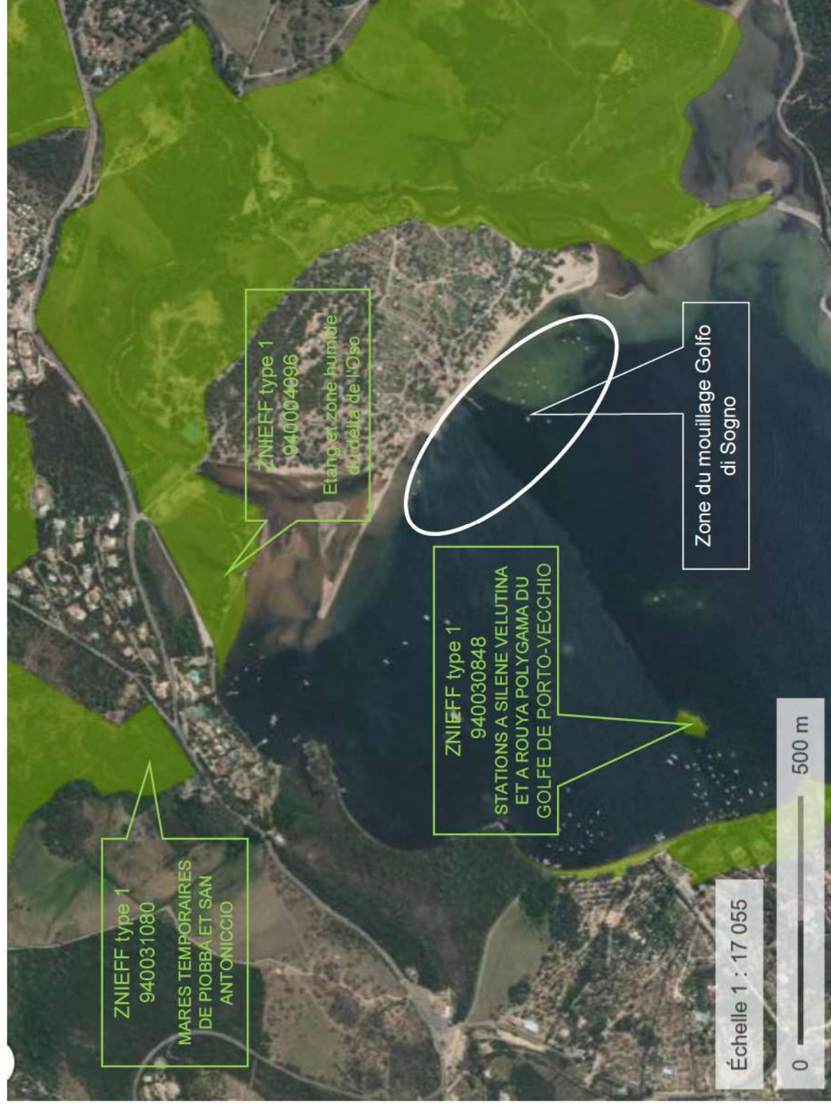
Figure 7 : ZNIEFF Type 01 à proximité des sites de mouillages Golfo di Sogno (Géoportail)

Projet de demande d'une AOT relative à la ZMEL Golfo di Sogno sur la commune de Lecci