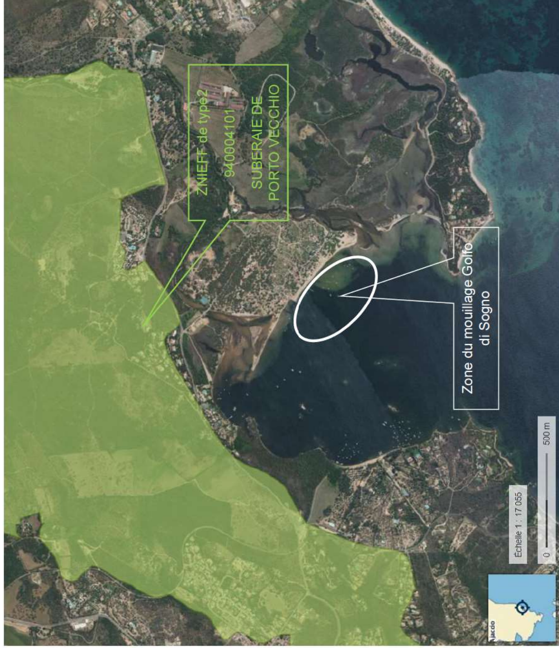
Figure 8 : ZNIEFF Type 02 à proximité des sites de mouillages Golfo di Sogno (Géoportail)

Projet de demande d'une AOT relative à la ZMEL Golfo di Sogno sur la commune de Lecci