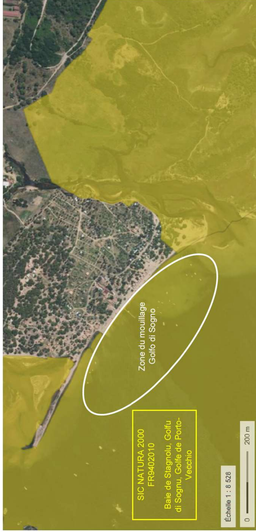
Figure 6 : Localisation des sites de mouillages de Golfo di Sogno dans le périmètre du site Natura 2000 FR9402010 (Géoportail)

Projet de demande d'une AOT relative à la ZMEL Golfo di Sogno sur la commune de Lecci