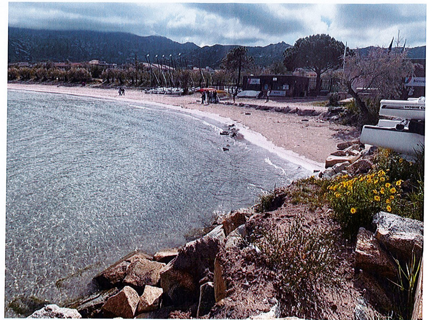
Figure 2 : PHOTO 2