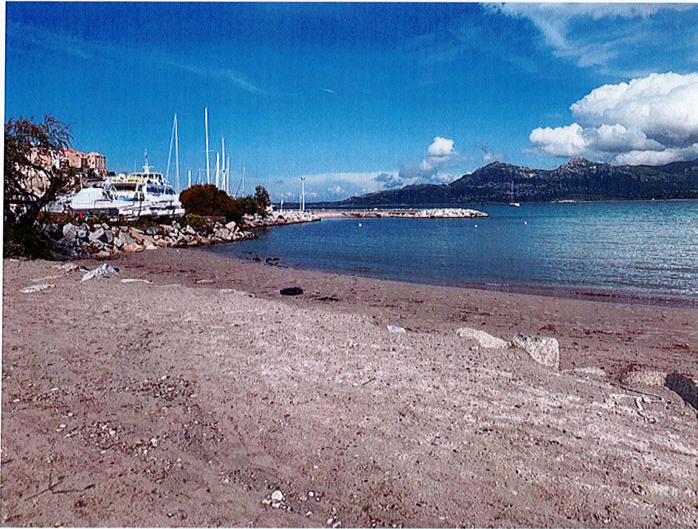
Figure 1 : PHOTO 1