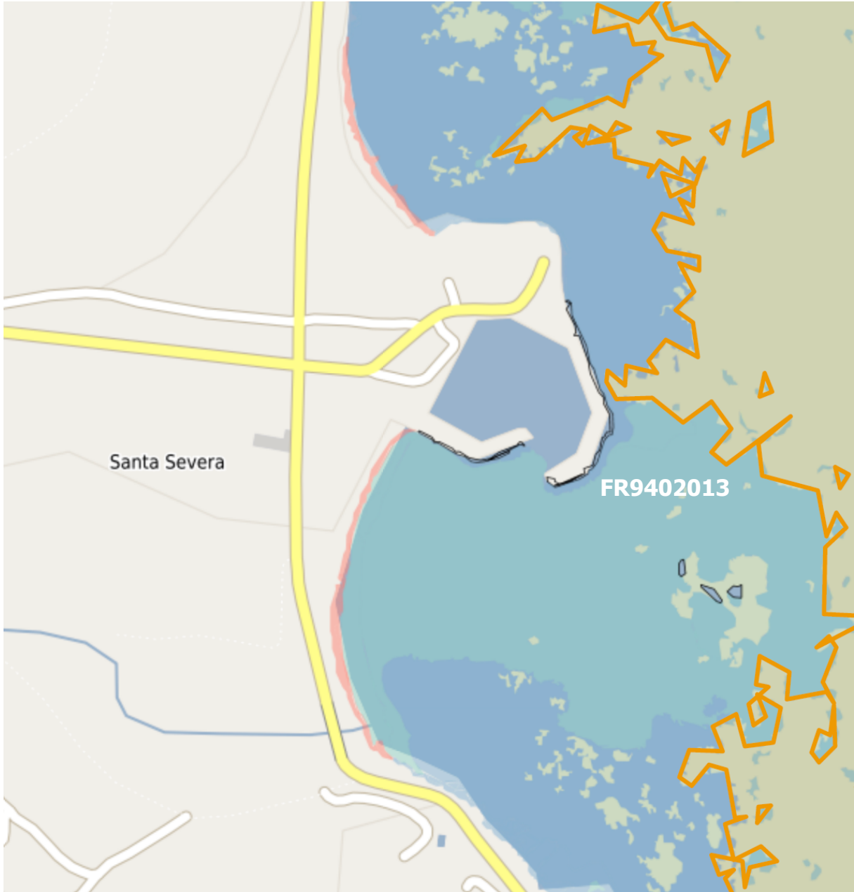
Extrait GeOrchestra Corse octobre 2022