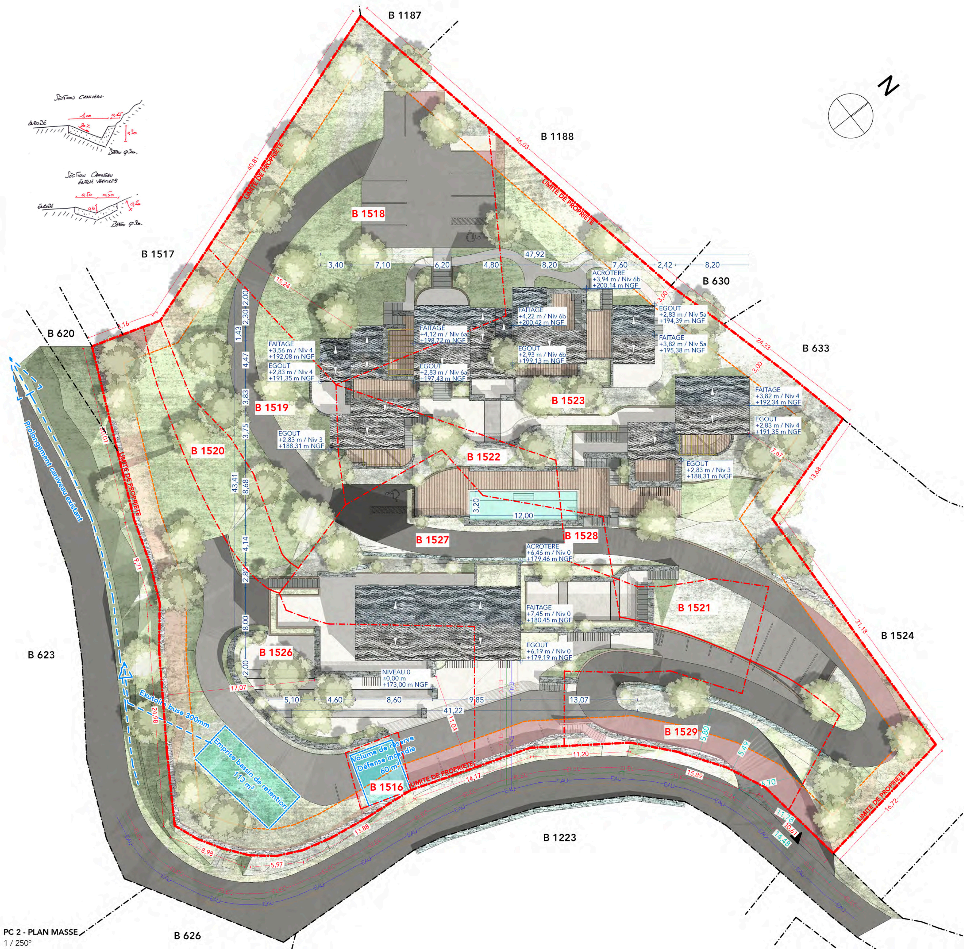
PC 2 - PLAN MASSE 1 / 250°