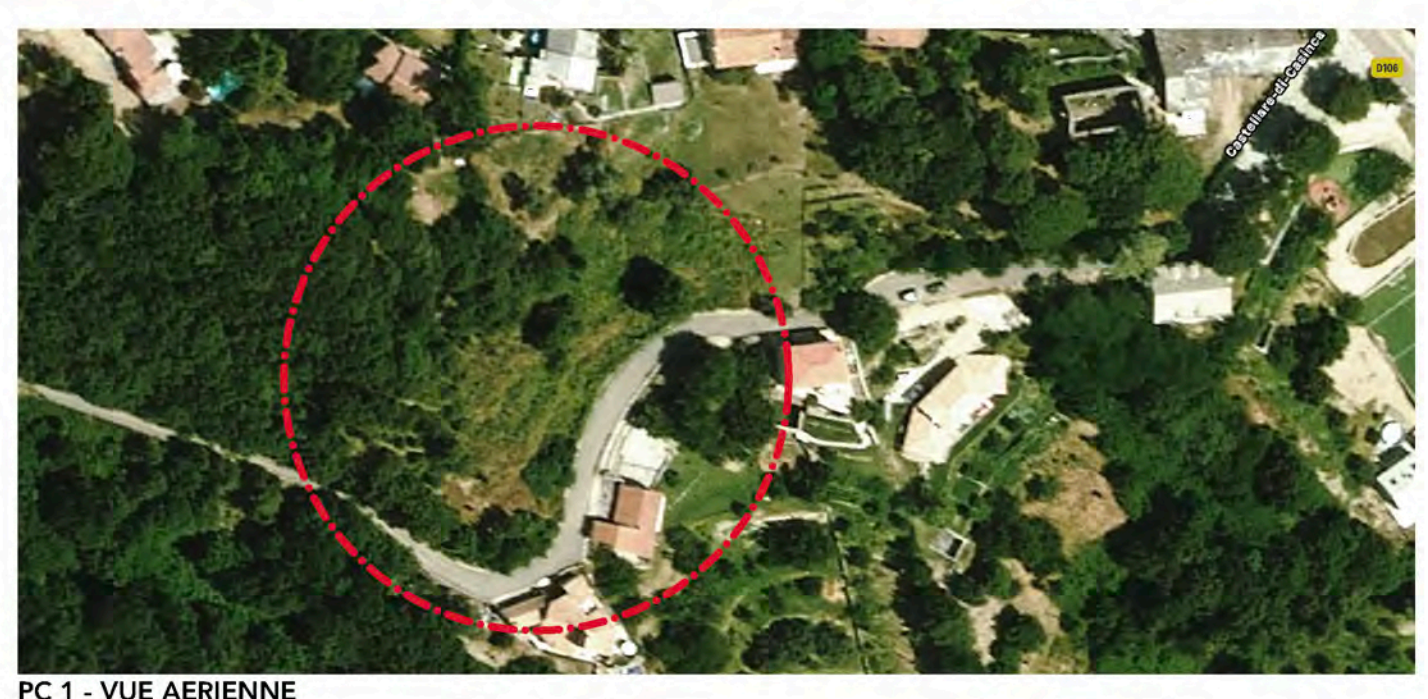
PC 1 - VUE AERIEENNE