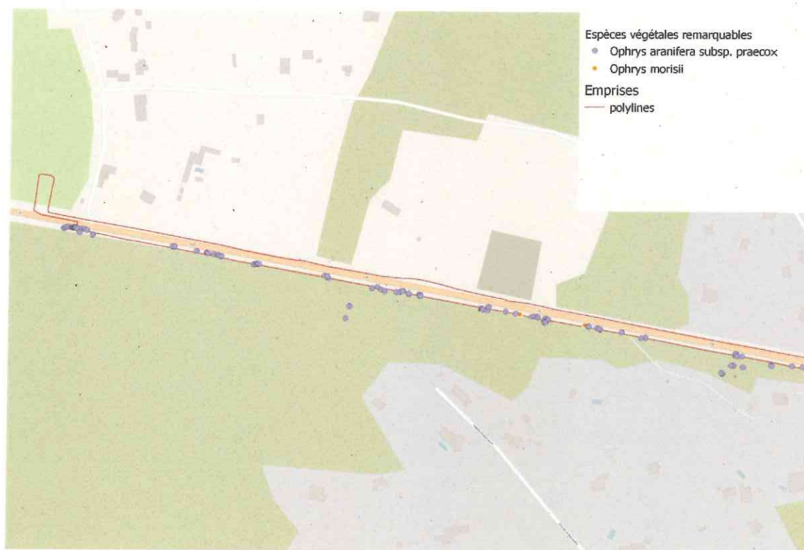
Extrait du dossier technique – voie verte de Bonifacio