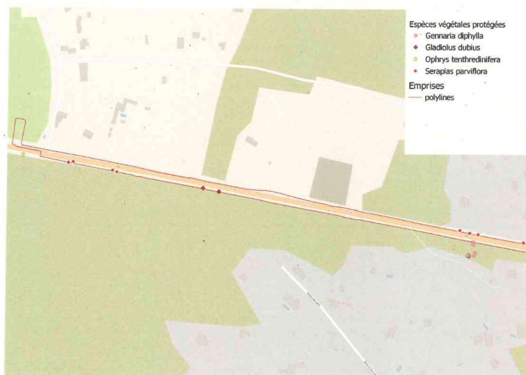
Extrait du dossier technique – voie verte de Bonifacio