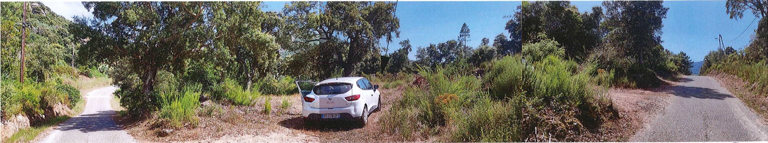
TERRAIN ENVIRONNEMENT PROCHE