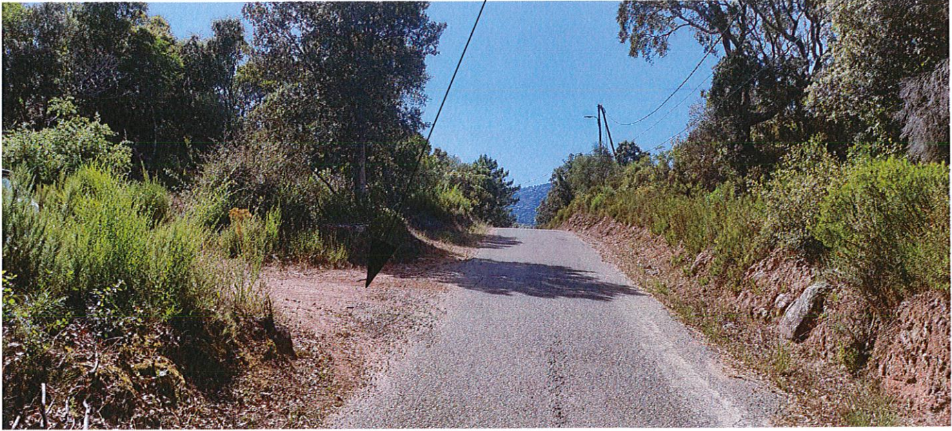
TERRAIN ENVIRONNEMENT PROCHE