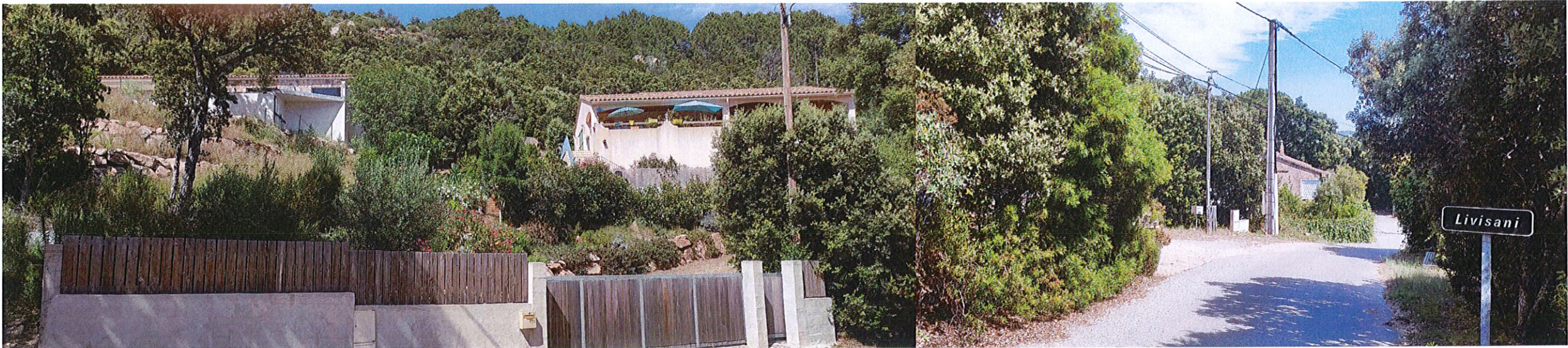
VUE DANS L'ENVIRONNEMENT LOINTAIN