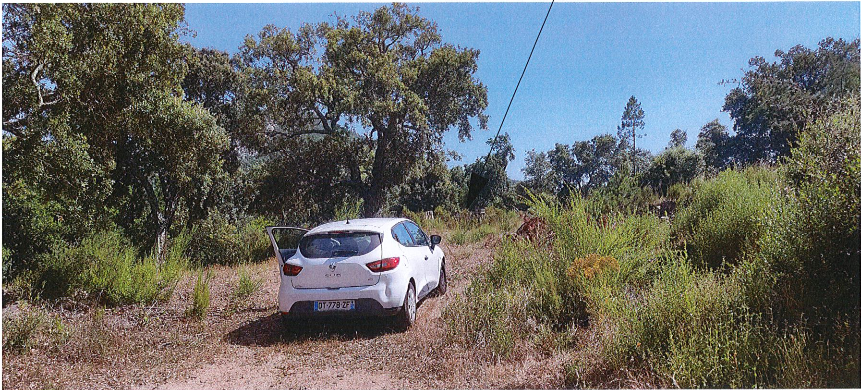
TERRAIN ENVIRONNEMENT PROCHE