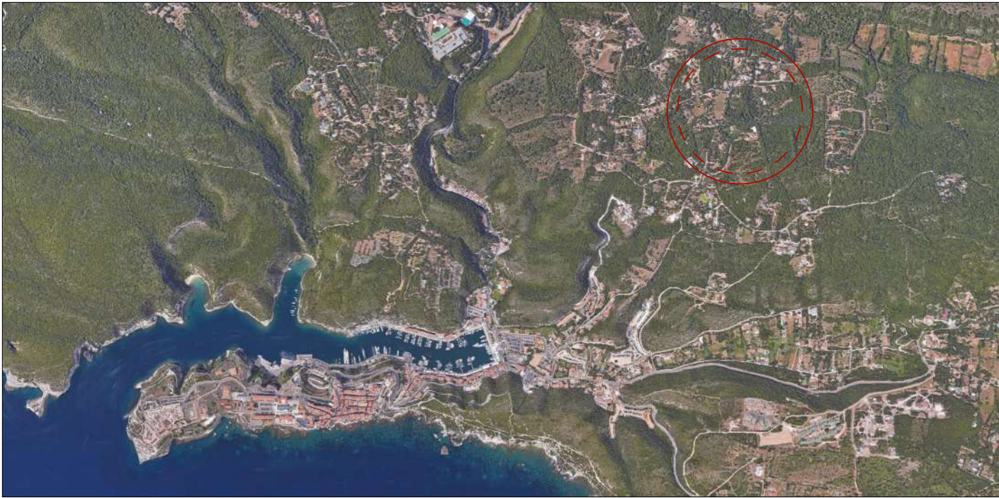
Vue aérienne / Plan de situation du terrain Lieu dit "Padorelle"