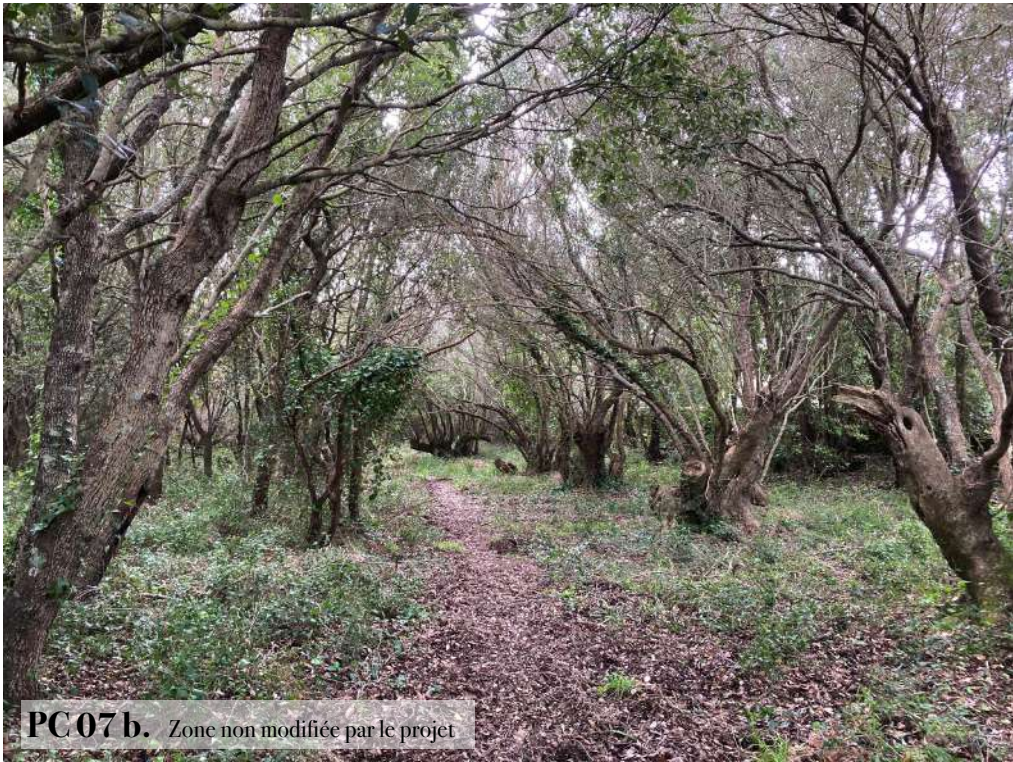
PC 07 b. Zone non modifiée par le projet