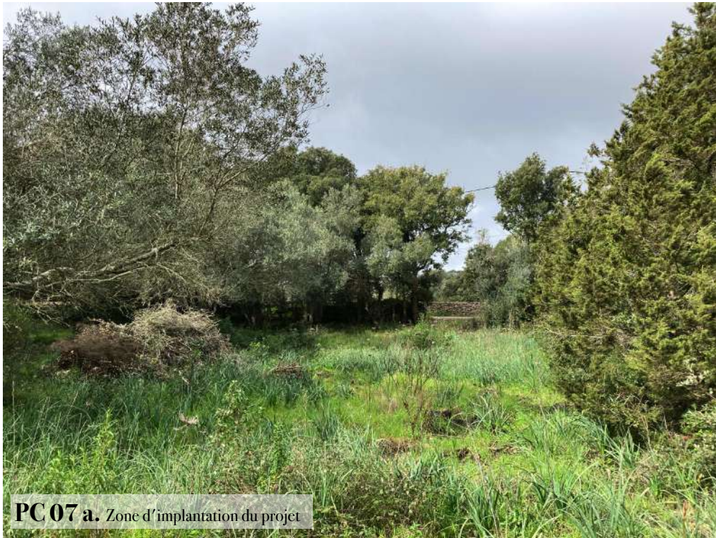
PC 07 a. Zone d'implantation du projet