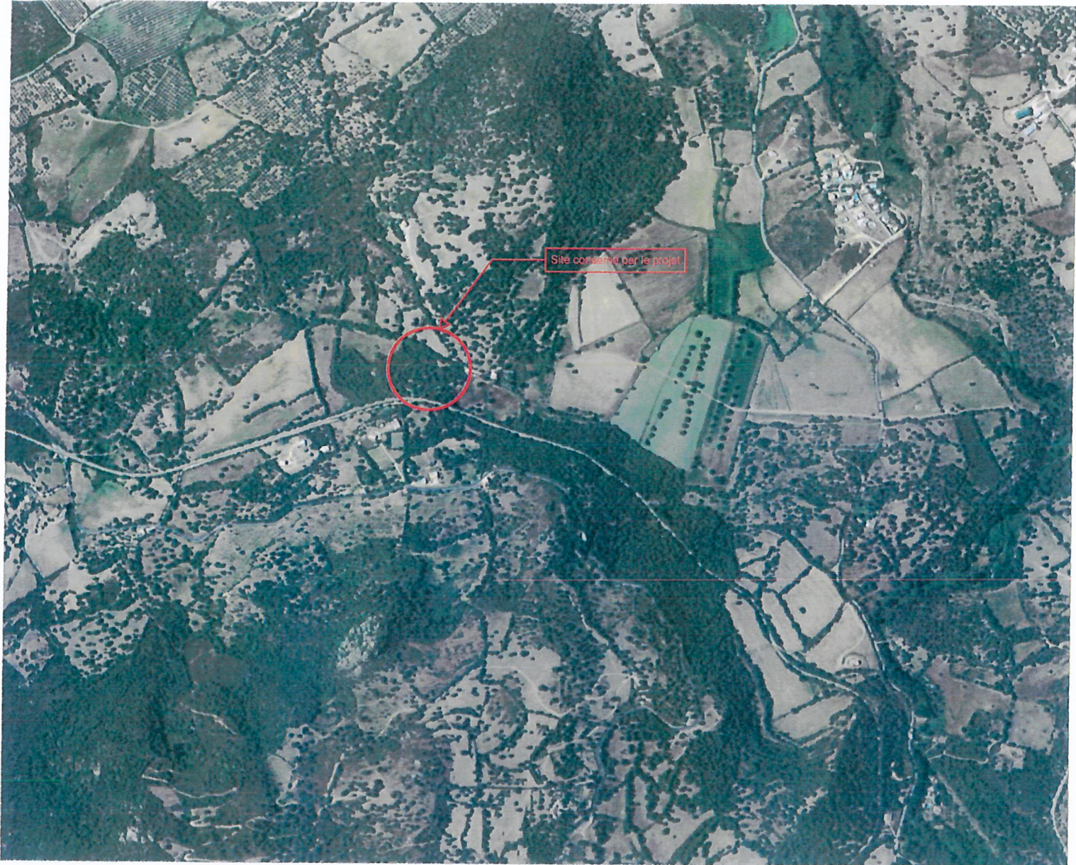
à l'échelle du quartier