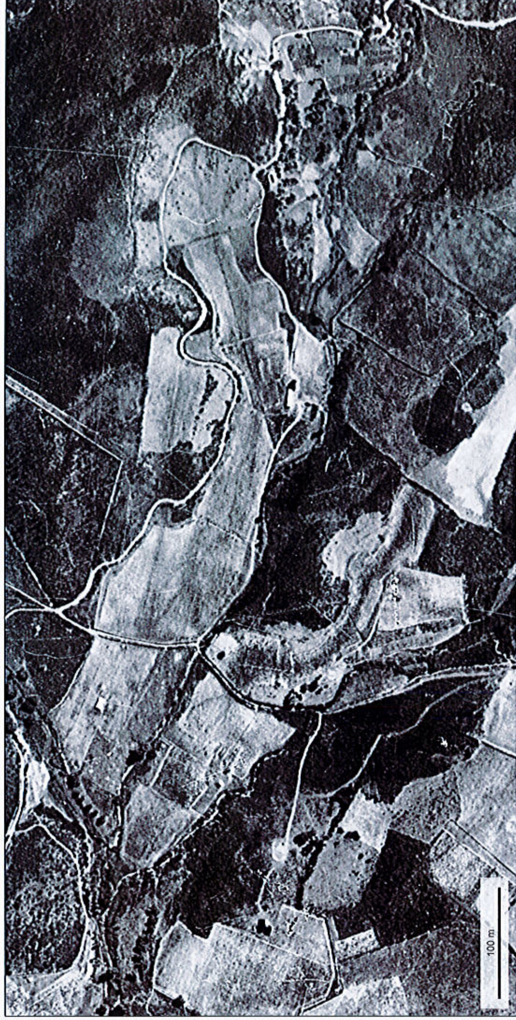
Carte IGN 1950 1/3135