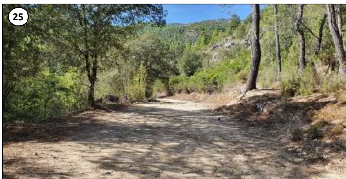
25 - Suite