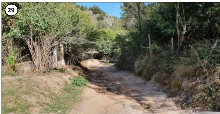
29 - La piste sur le secteur emprunté par la ligne permettant le raccordement de la centrale au réseau électrique.