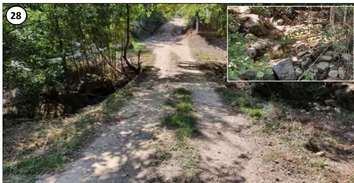
28 - Vue vers l'ouest du passage de la piste et de la conduite sur le ruisseau de Giannulella (en vignette).