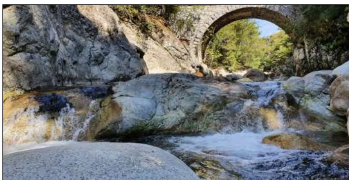
O2 - Toboggan sur dalle en aval immédiat du pont de Pinu.