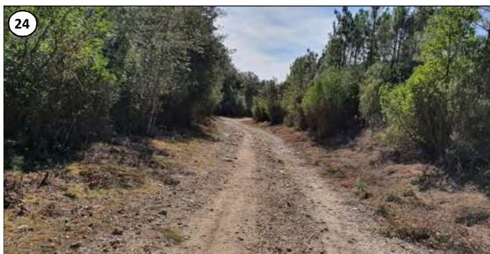
24 - Piste en amont de la centrale