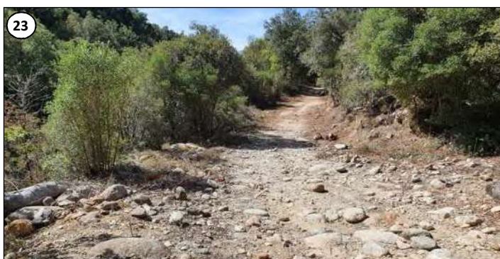
23 - La piste en aval du pont de Pinu.