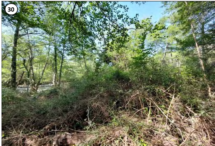
30 - Site d'implantation de la centrale en rive droite de la Gravone qui est visible en contrebas au niveau de la restitution projetée.