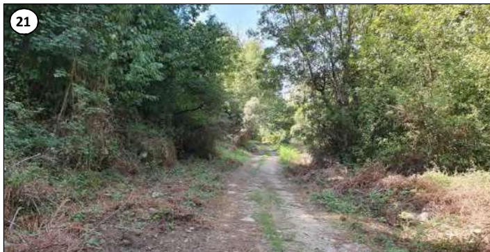
21 - Suite.