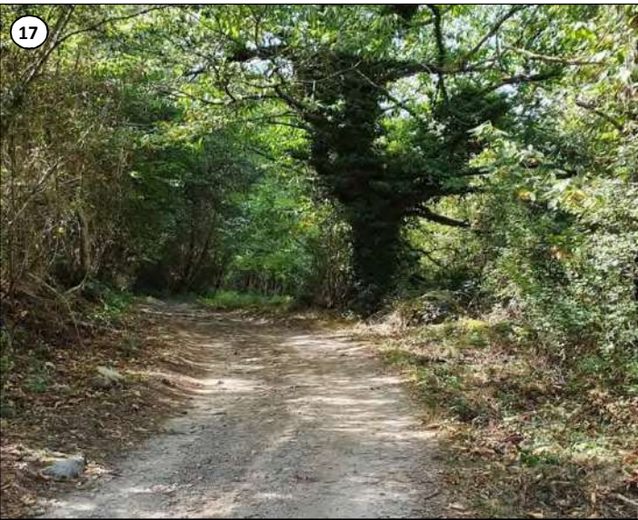
17 - Jonction du tracé avec la piste (vue vers l'aval). Vue sur le seul vieux châtaigner du tracé, à préserver lors des travaux.