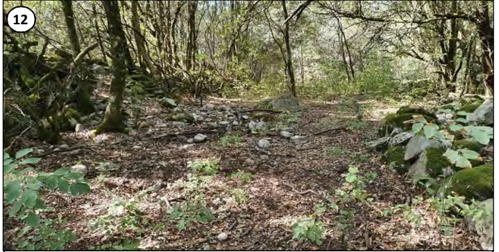
12 - Amorce de virage pour rejoindre la piste et arrivée en terrain plat.