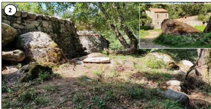
2 - Site de passage de la conduite forcée en arrière du moulin de Busso (vu de face en vignette).