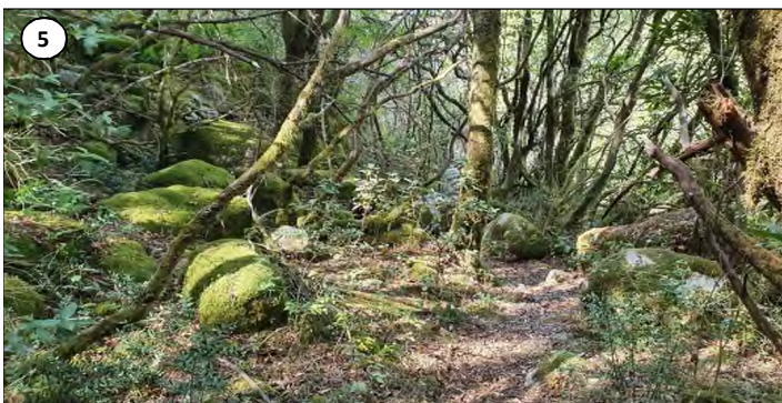
5 - Ambiance forestière du maquis au niveau du passage de la conduite forcée.