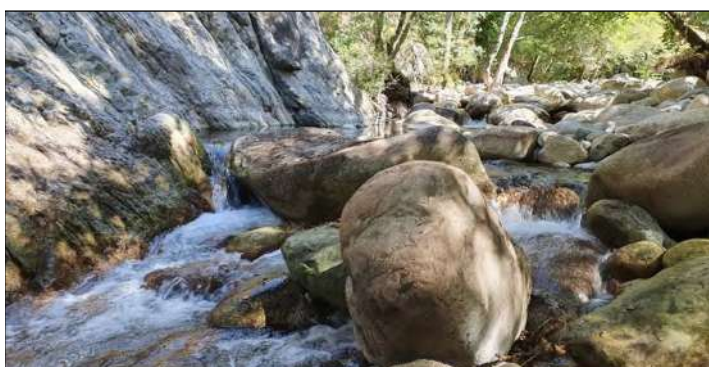
O3 - Cascades infranchissables à l'étiage.