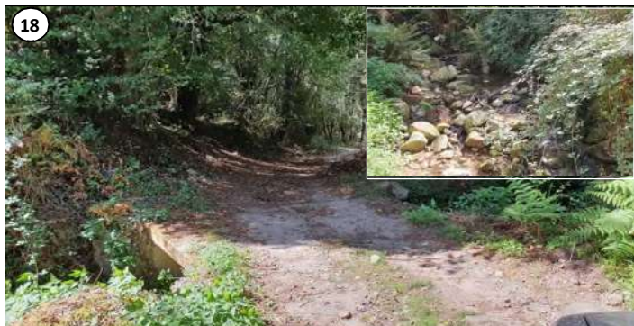
18 - Passage de la piste et de la conduite sur le ruisseau de Landagliaccio (dallot) : en vignette, ruisseau vu d'aval.