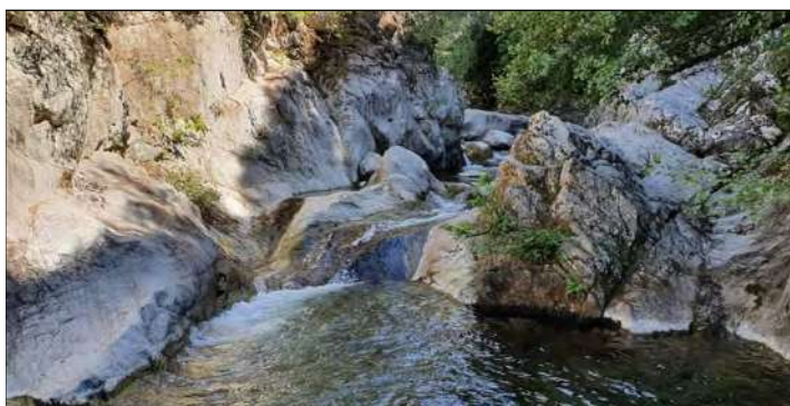
O1 - Toboggan sur dalle au niveau d'un rétrécissement du lit en aval du pont de Pinu.