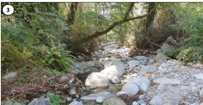
3 - Bras secondaire de crue (vue d'amont) qui sera longé à gauche par la conduite peu après la passerelle.