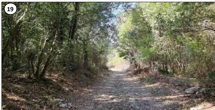
19 - Vue de la piste vers l'aval.