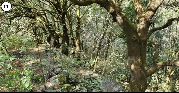
11 - Alignement de beaux chênes verts en limite de parcelle. Le trajet de la conduite empruntera le replat à gauche de l'image.