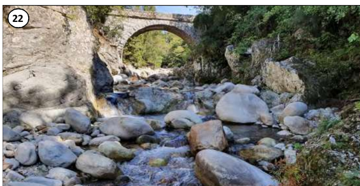
22 - Le Pont de Pinu vu d'aval.