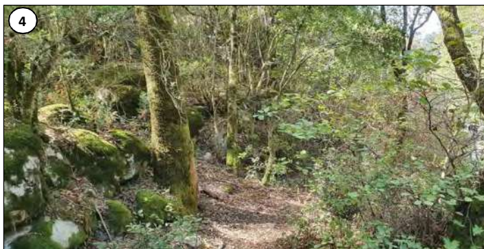
4 - Entrée de la conduite en milieu forestier : maquis de chênes verts.