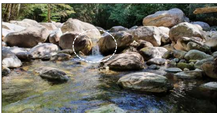
O4 - Cascade infranchissable à l'étiage.