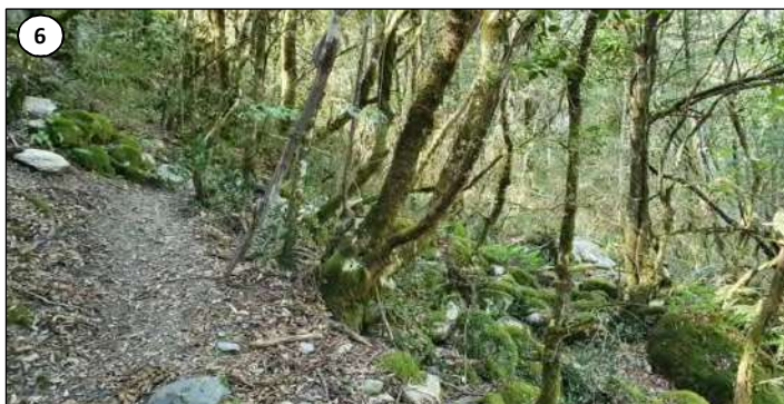
6 - Passage de la conduite forcée au niveau du rebord de la "cuesta" formée par la vallée de la Gravone.