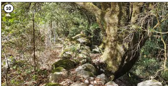
10 - Passage de la conduite en limite de parcelle (clôture à gauche). Vue montrant un chêne vert remarquable à préserver.