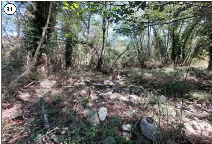
31 - Site d'implantation de la centrale vu depuis la berge rive droite de la Gravone.