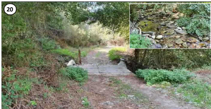
20 - Passage de la piste et de la conduite sur le ruisseau de Bronco : en vignette, ruisseau vu d'aval.