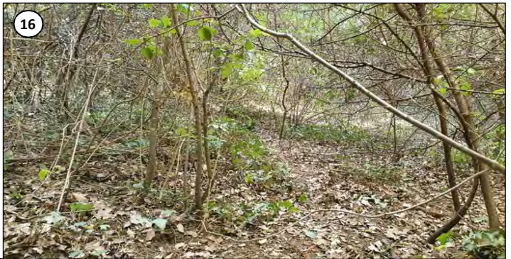
15 & 16 - Zone plane en bordure d'une ruine au maquis toujours très clairsemé.