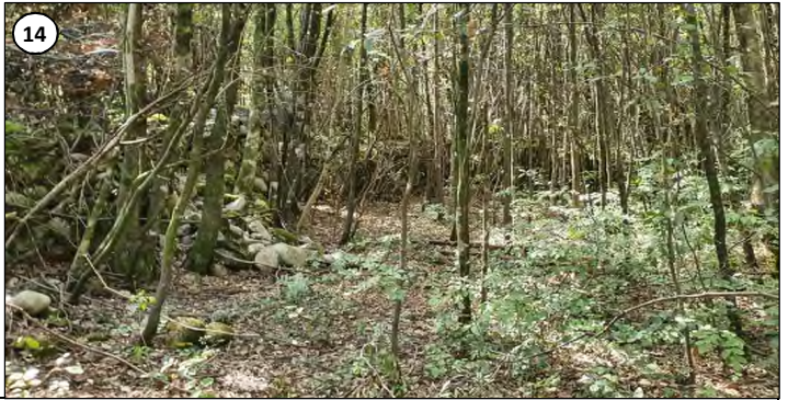
13 et 14 - Terrain plat succédant à la "cuesta" où le maquis constitué de frênes à fleurs ( Fraxinus ornus ) est très clairsemé.