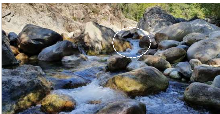
O5 - Rétrécissement du lit où le seul passage pour le poisson est la cascade (cerclée), infranchissable à l'étiage.