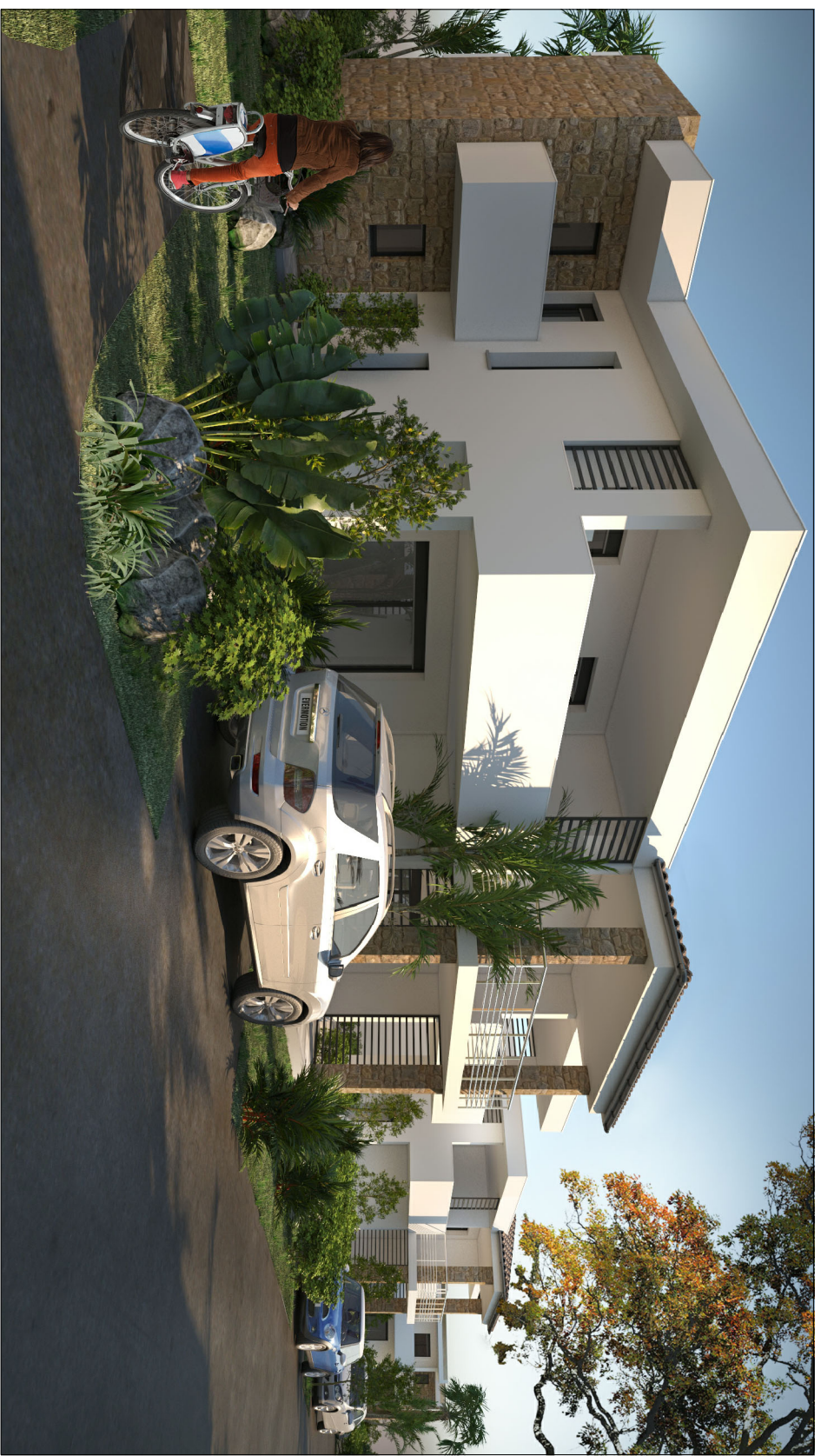
VUE - 1

Maitre d'ouvrage : JP BAUDE LES ECHOPPES 20166 PORTICCIO Localisation du projet : REALISATION DE 62 DUPLEXES Lieu dit "Prunette" 20221 - Cervione Section D - Parcelle N° 1447 - Surf. = 19743 m²