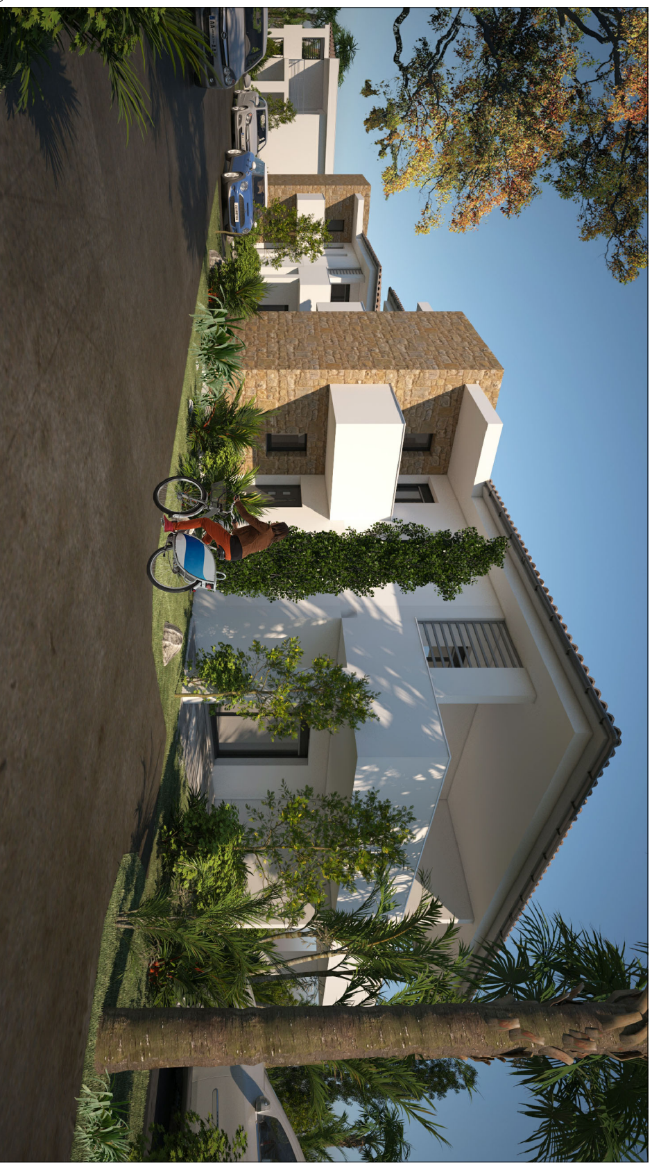
VUE - 2