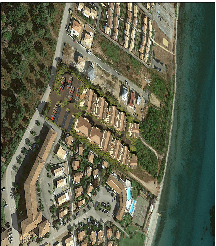
INSERTION AU SITE