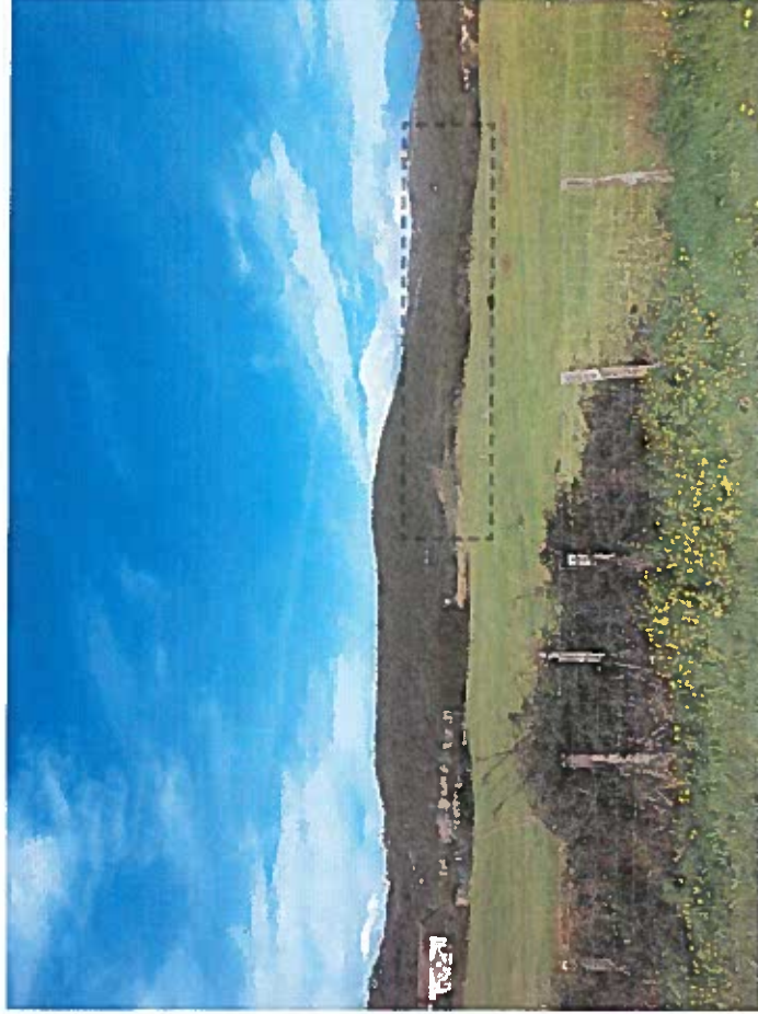
ENVIRONNEMENT LOINTAIN direction Ouest (photo prise le 29/03/2018)