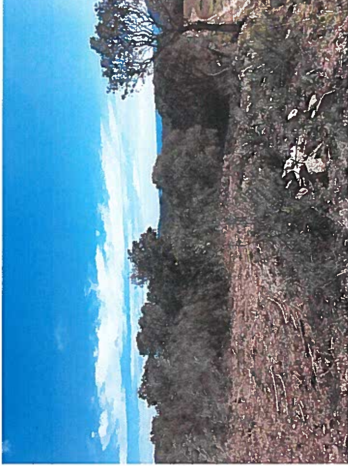
ENVIRONNEMENT PROCHE direction Est