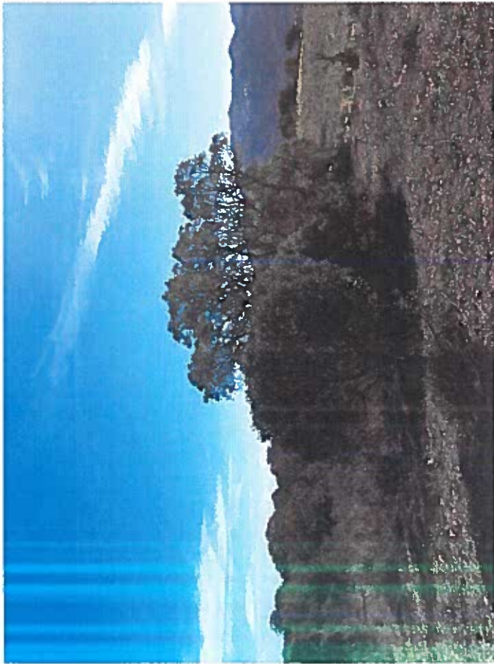
ENVIRONNEMENT PROCHE direction Sud-Est