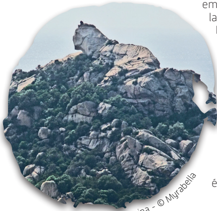
Lion de Roccapina