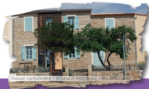
Maison cantonnière - A Casa di Roccapina - © CRPG Corse

Dès la Préhistoire, les taffoni ont été occupés, fermés par des branchages ou des murs de pierre sèche. Site touristique, des informations sont disponibles à « A Casa di Roccapina », ancienne maison cantonnière réhabilitée en centre d'interprétation.