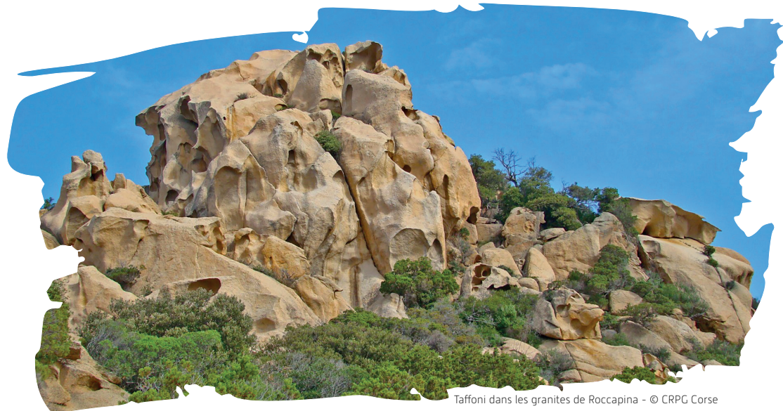
Taffoni dans les granites de Roccapina