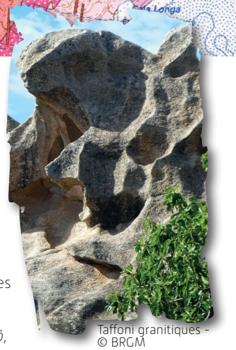
Taffoni granitiques

Pour les autres, ce phénomène est avant tout provoqué par des processus endogènes (du grec endon , dedans et gennan , engendrer). Lors du refroidissement du magma granitique en profondeur dans la croûte terrestre, le passage de l'état liquide à l'état solide génère des structures cristallines invisibles à l'œil nu. Ces microstructures, zones de faiblesse du granite vont permettre une perméabilité plus grande et favoriser l'altération du granite par le vent, l'eau, le sel et le soleil lorsque la roche sera portée en surface par un lent processus d'érosion ou par des événements tectoniques.