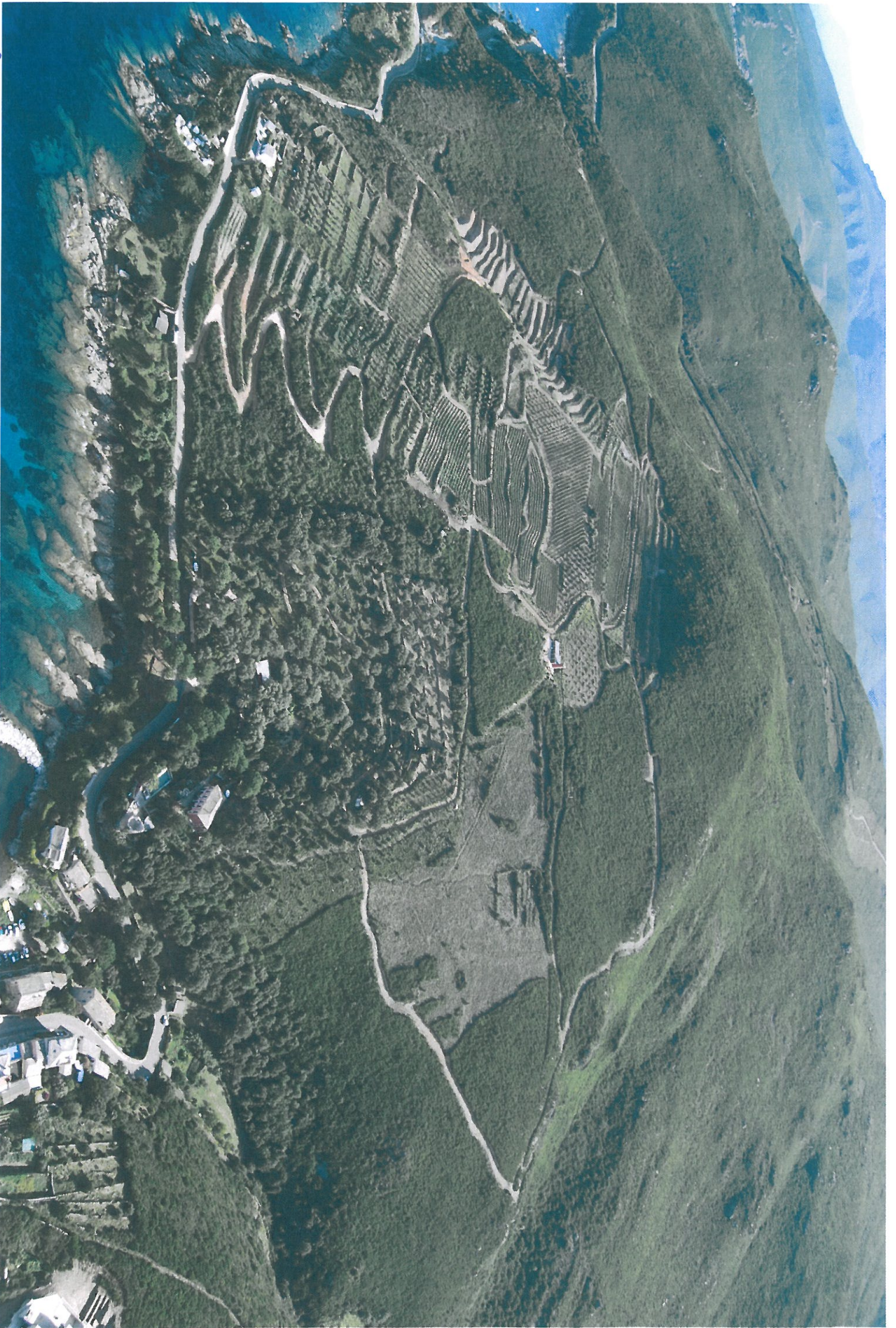
PHOTO AERIENNE 08/2014