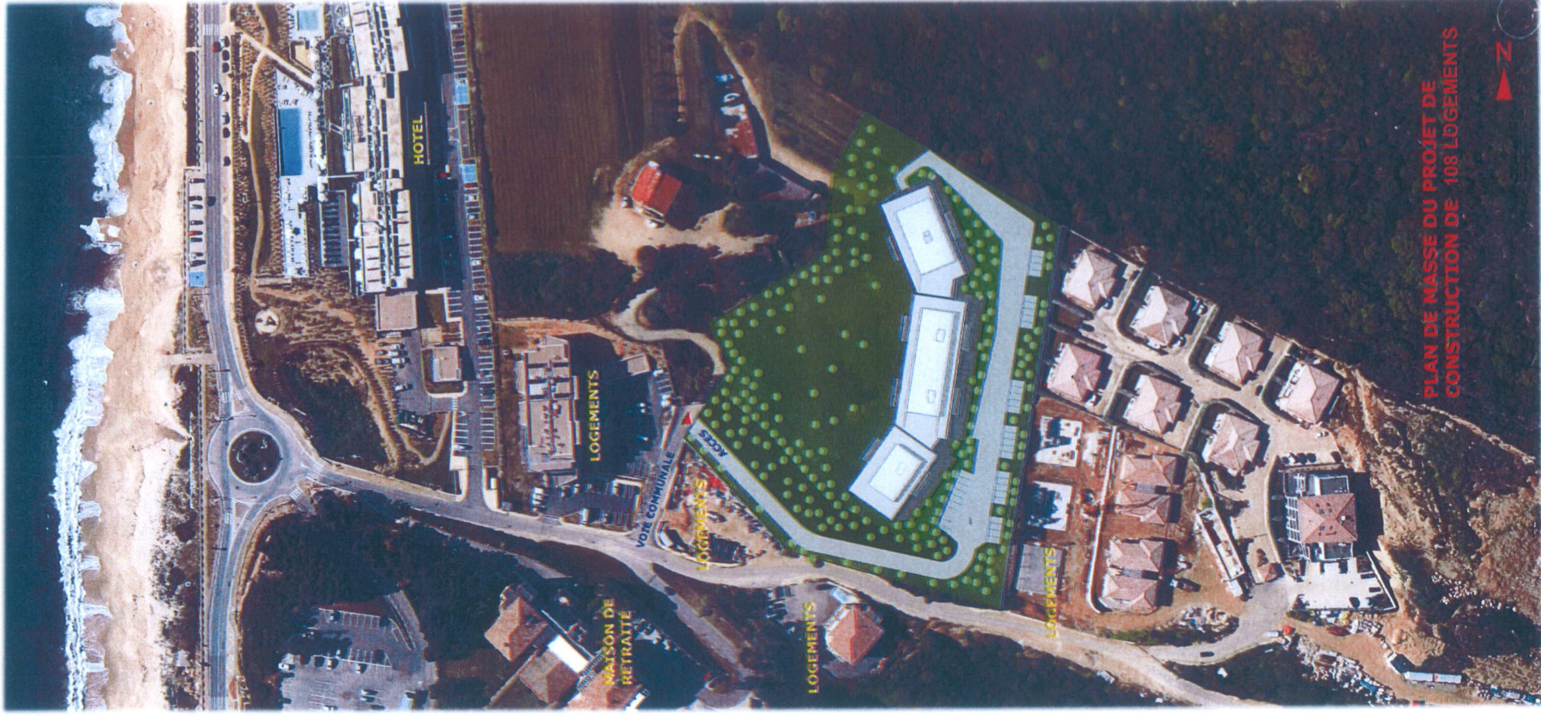
PLAN DE MASSE DU PROJET DE CONSTRUCTION DE 108 LOGEMENTS