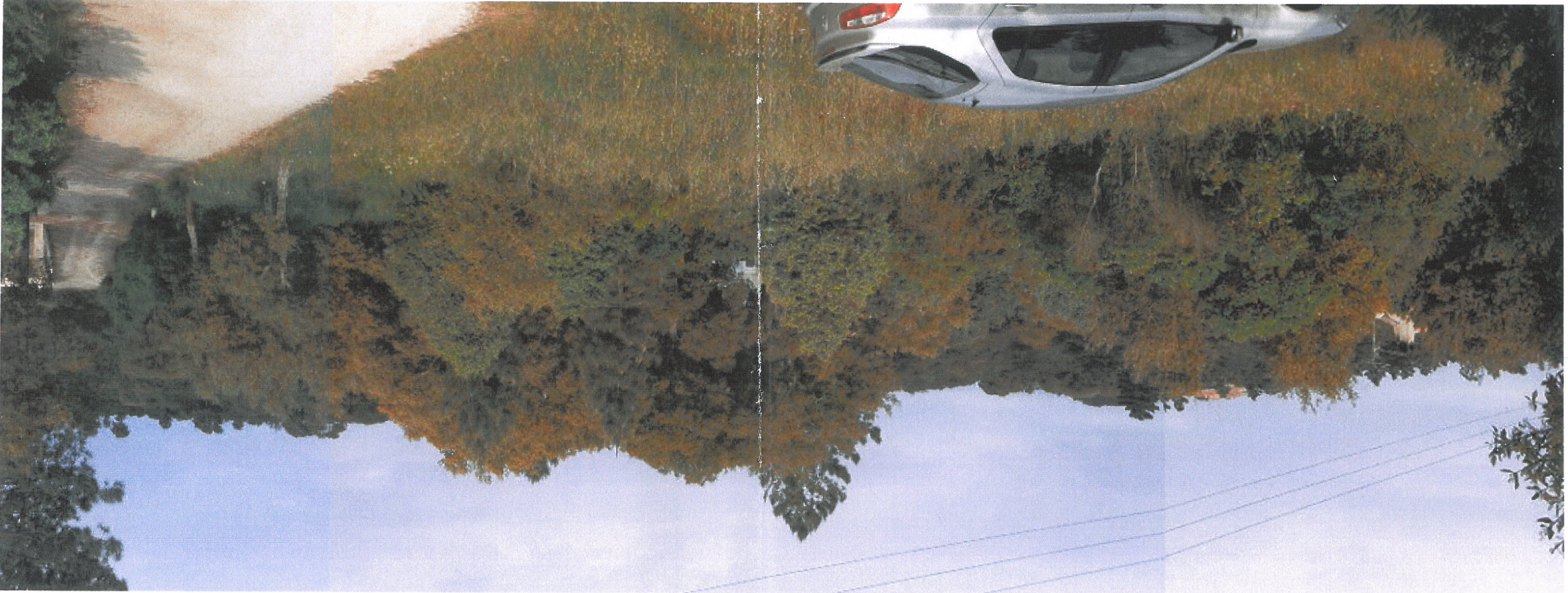
EXISTANT VUE 1