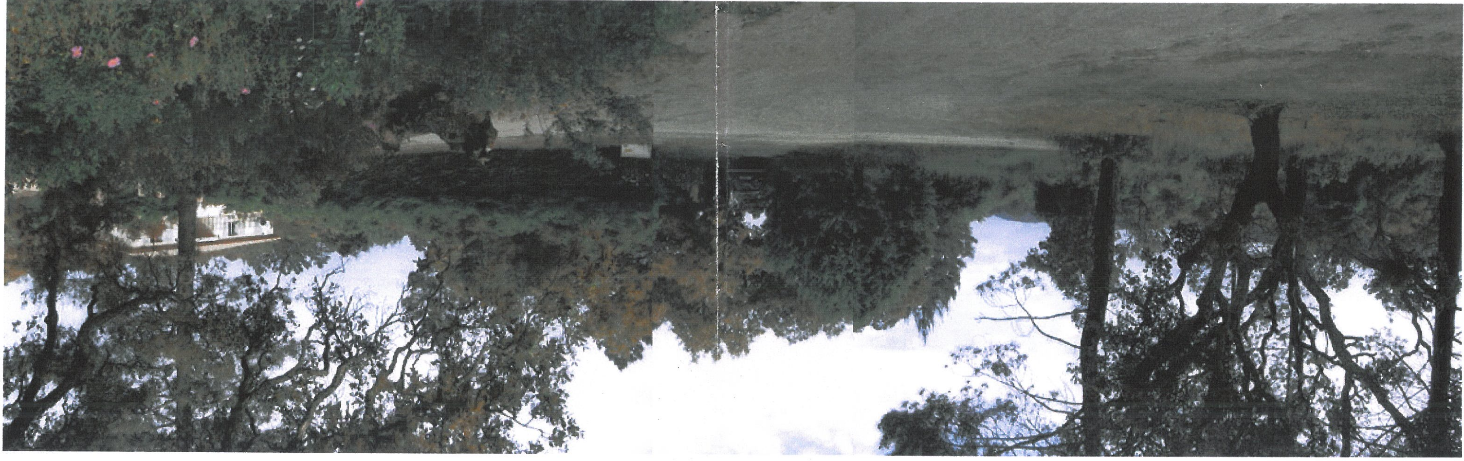
EXISTANT VUE 2